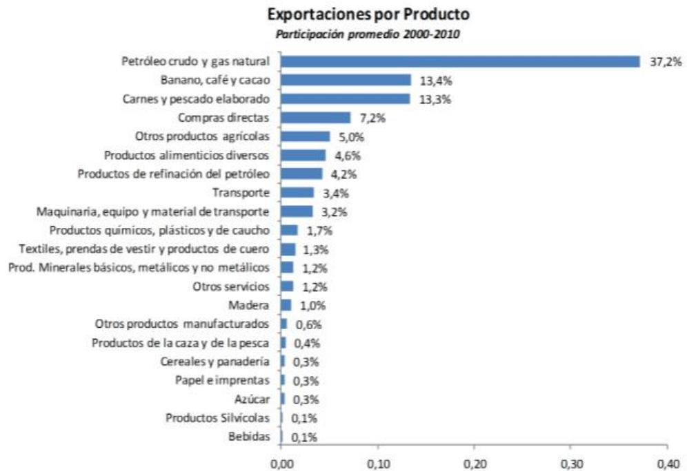
Figura 2. Fuente: Exportaciones por producto, participación promedio 2000-2010. Recuperado de Dirección de Estadísticos Económicos del portal del INEC (2010).

Llevando el enfoque de las exportaciones en la industria del calzado ecuatoriano, en el año 2016 se obtuvo un crecimiento. Según el portal El Ciudadano, las exportaciones del sector ascienden a 38,9 millones de dólares y sus destinos principales fueron Colombia, Perú, Venezuela, Guatemala y Estados Unidos (El Ciudadano, 2016).