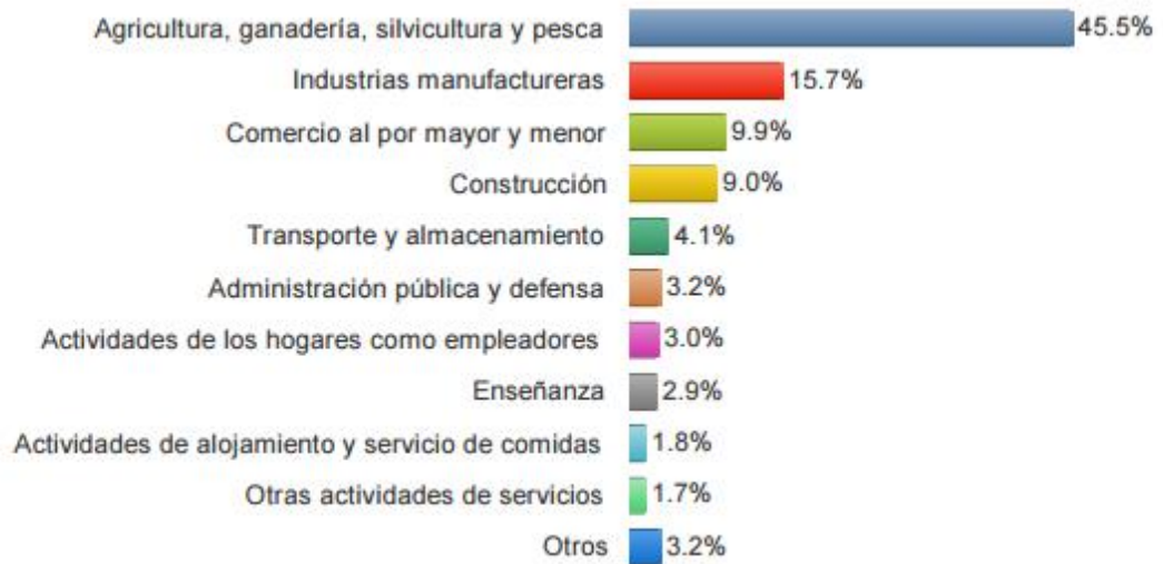
Figura 1. GUANO: Población Ocupada por Rama de Actividad. Recuperado del portal del INEC (2010)

Acorde con la figura 1 refleja las principales actividades del cantón. Como primera ocupación se encuentra la agricultura, ganadería, silvicultura y pesca representando el 45.5%, en segundo lugar se encuentra la industria manufactura con un 15.7% y en tercer lugar se encuentra el comercio al por mayor y menor con un 9.9%. Se puede inferir que principal sustento económico de esta población es la comercialización del cuero ya que es una de las ciudades más reconocidas en el Ecuador por el comercio de producto a base de cuero curtido. Adicional, según SNI, en el último censo realizado en el país arrojó que la industria manufacturera representa el 24.4% de las principales actividades que generan mayor ingreso.