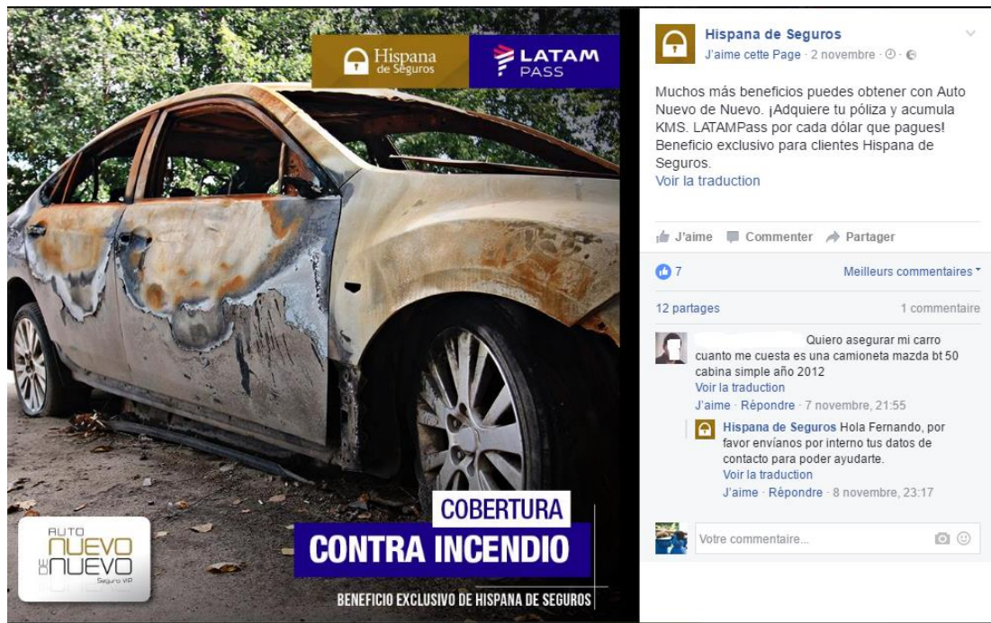
Figura 5. Ejemplo de atención al cliente y programa de fidelización en página Facebook (Hispania de Seguros, 2016).