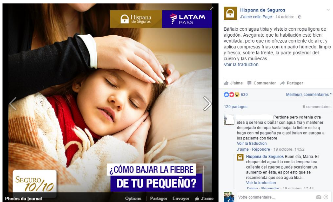
Figura 8. Ejemplo de atención personalizada en página Facebook (Hispana de Seguros, 2016).

En esta publicación de Hispana de Seguros, se nota la respuesta personalizada de la compañía hacia un comentario de su cliente. Las compañías de seguros, a través de la creación y publicación de contenido en las redes sociales, obtienen dar una respuesta inmediata y personalizada a sus usuarios, debido a que "los consumidores entienden que están interactuando con una persona real que responde mientras ellos escuchan" (Celent, 2016, p. 11). Esa reactividad, rapidez y personalización de la atención es clave en caso de un siniestro, pues el cliente estará a la espera de que el seguro que haya comprado sea útil y que la compañía le dé una respuesta conveniente y de lo más rápido posible (Accenture, 2014).