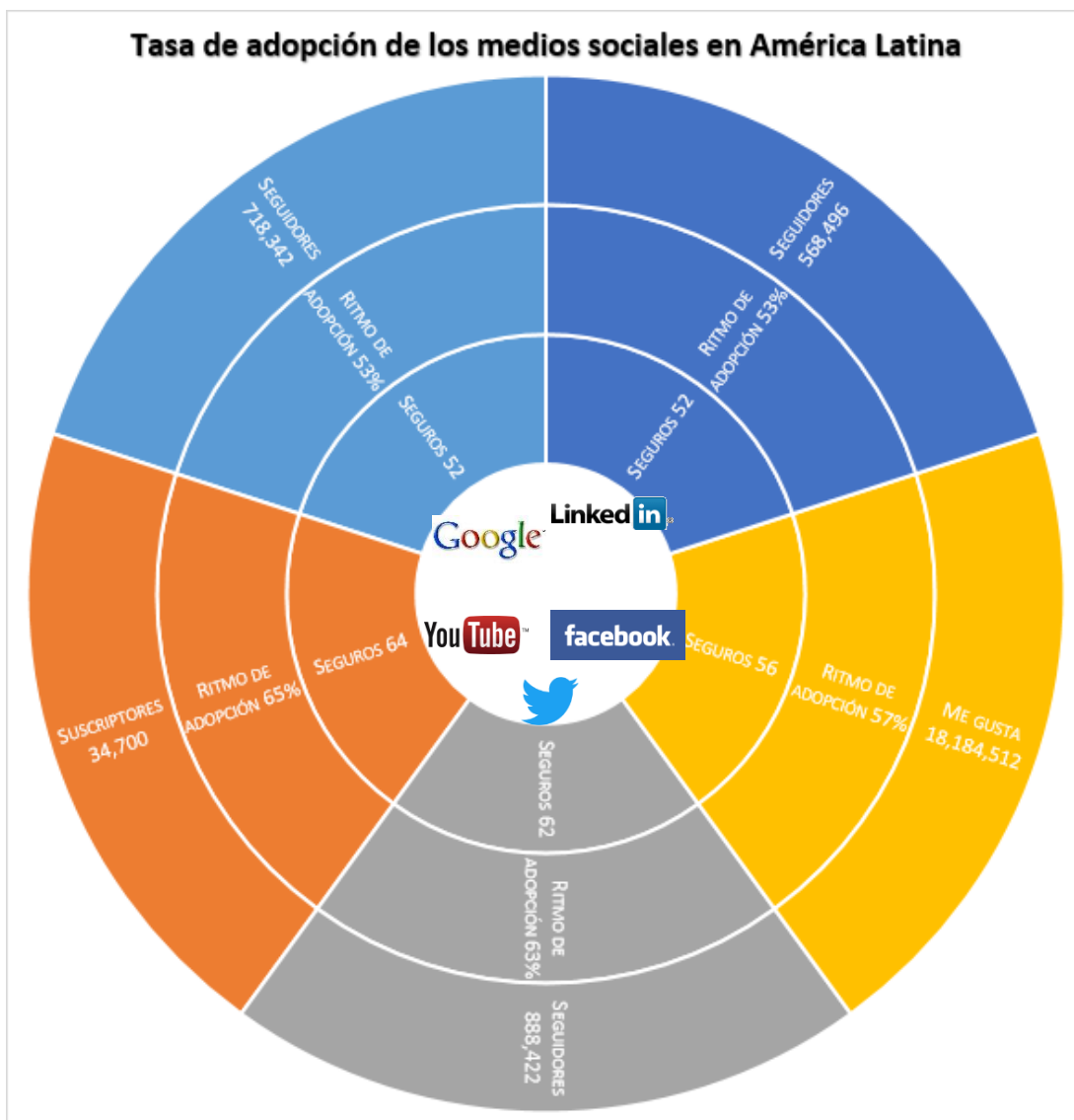
Figura 3. Tasa de adopción de los medios sociales en América Latina. ¿Adaptado de “Are insurers really embracing social media?” por Celent.

Si la población más importante se encuentra en Brasil (con 13,67 millones de personas), Ecuador se ubica en la sexta posición con alrededor 860.000 usuarios de redes sociales, repartidos de la siguiente manera: 853.823 usuarios de Facebook, 1539 en Twitter, 1299 en LinkedIn, 91 en YouTube y 4 en Google + (Celent, 2016). Además, el informe destaca que, en Brasil, Chile, Ecuador y Perú, las compañías de seguro parecen haber puesto en marcha estrategias de mayor importancia para obtener un público en crecimiento. De hecho, en los países sub-mencionados, “la penetración del social media (seguidores del seguro divididos por la población) es más alta que la penetración del seguro” (Celent, 2016, p. 19).