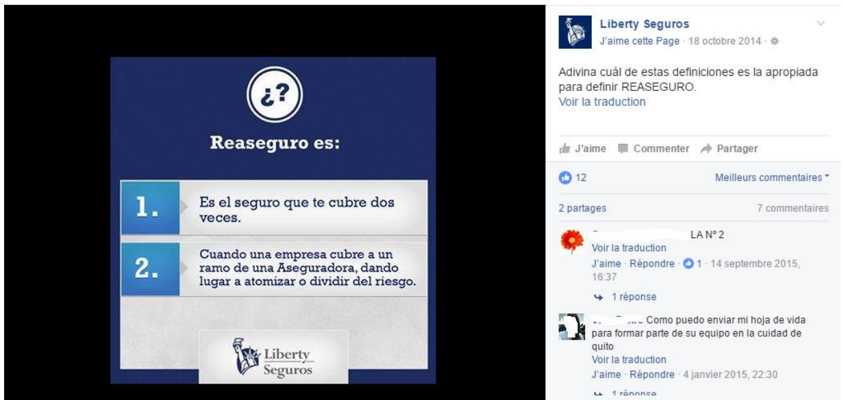
Figura 6. Ejemplo de juego en página Facebook (Liberty Seguros, 2014)