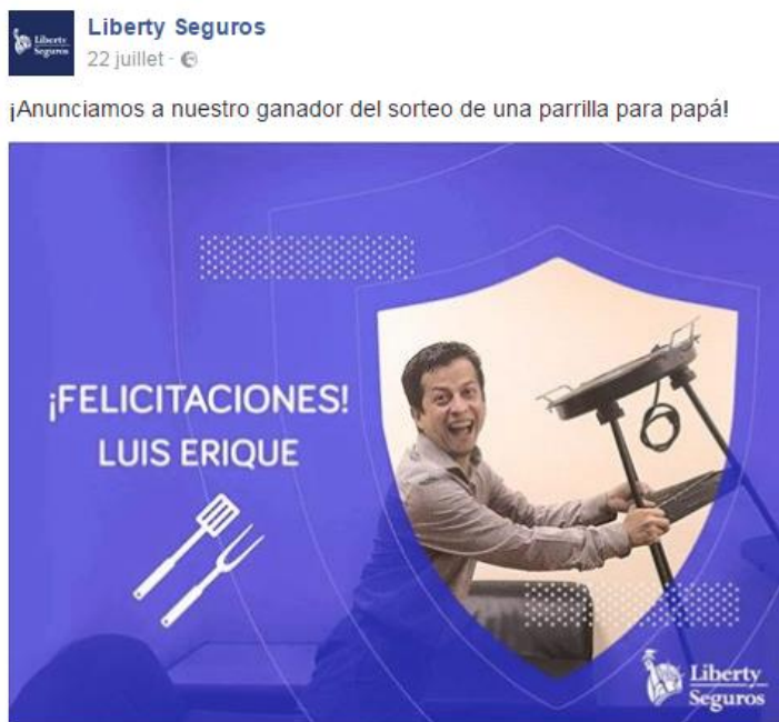
Figura 7. Ejemplo de sorteo en página Facebook (Liberty Seguros, 2016)

A parte de los programas de fidelización clásicos, la introducción de las redes sociales hace evolucionar las representaciones que tienen las compañías sobre su mercado, pues se genera una cantidad considerable de datos gracias a las interacciones entre el cliente y la empresa. Los resultados de las entrevistas indican que es la mejor forma de comprometer a los clientes diariamente para que interactúen con las compañías, que sea en caso de un siniestro o para expresar su contentamiento o una interrogación.