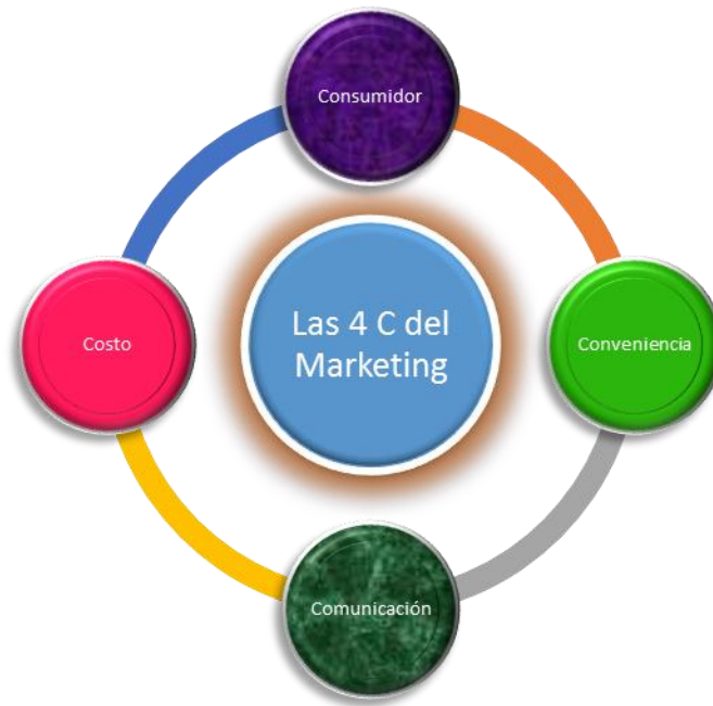
Figura 2. Las 4 C del marketing. Adaptado de “Las 4 C del Nuevo Marketing” por Jorge Ramírez.

En primer lugar, como ya se ha mencionado, este nuevo marketing se concentra en el análisis de las necesidades del consumidor , no en el producto. En segundo lugar, es primordial identificar el coste -beneficio atribuido por el consumidor para satisfacer su necesidad. Desde ahora, se deben considerar varios criterios, sin limitarse al precio del producto. En tercer lugar, la convivencia , es decir la facilidad de realizar la compra, debe ser considerada en todo su proceso, desde un punto de vista integral. Por fin, la comunicación entre el consumidor y el productor tiene que ser permanente y durable, llegando a “un marketing de relaciones” (Hernández y Maubert, 2009, p.20). Dichas relaciones buscan instaurar una colaboración, dónde los intereses de los dos coinciden. En efecto, gracias a esta comunicación, el consumidor está mejor informado, pero también puede opinar sobre el producto con el objetivo que la oferta se vaya mejorando, resultado de la retroalimentación.