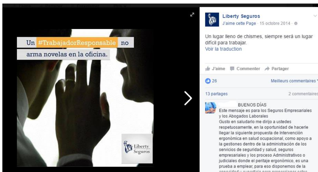
Figura 9. Ejemplo de contenido segmentado en página Facebook (Liberty Seguros, 2014)