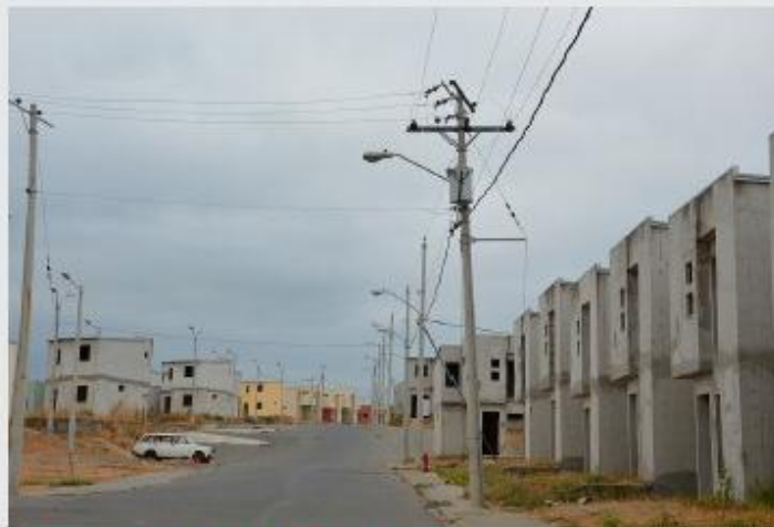
Plan de vivienda sin acogida A escasos metros de Ciudad Victoria, hay un recinto urbanístico privado sin terminar, dado el escaso interés del mercado en esa zona.

Forma de financiación: Bono de reasentamiento de $12.500, con el compromiso de que el beneficiario cancele $900 en cuotas mensuales de $15, durante diez años.