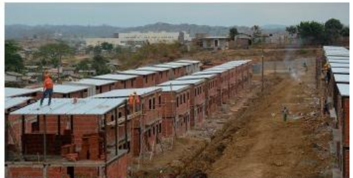
NUEVO PLAN DE VIVIENDA Se edifican viviendas dúplex de 2 plantas, con capacidad para setenta familias en el sector de Las Marías.

“ Hicieron salir a familias de los hogares y con una notificación de apenas 48 horas para desalojar ”