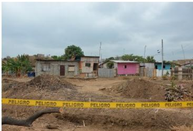
DESALOJO Las Marías, último sector intervenido por la Secretaría Técnica de Asentamientos Humanos y Irregulares (STAH).

La intervención del “área reservada de seguridad”, a cargo de militares y agentes de la fuerza pública, fue duramente criticada.