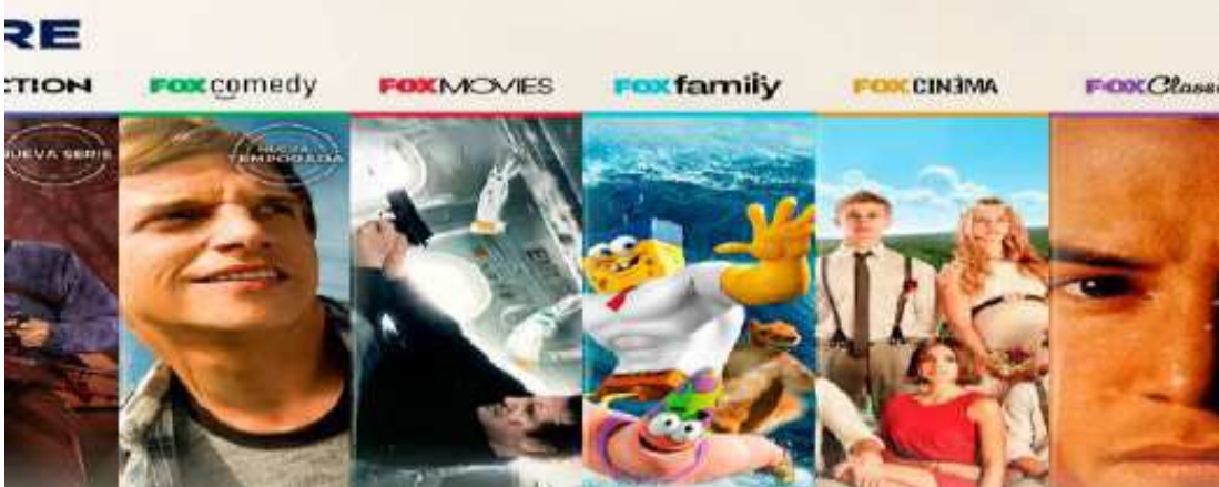
Figura. 6 Planes de CNT TV