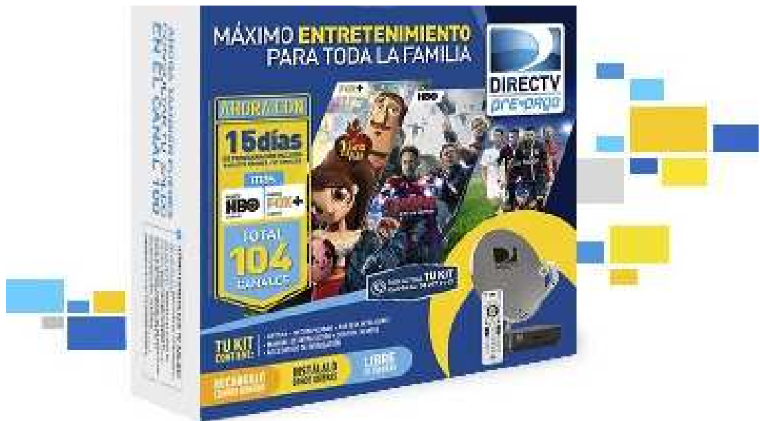
Figura. 4 Publicidad de DIRECTV