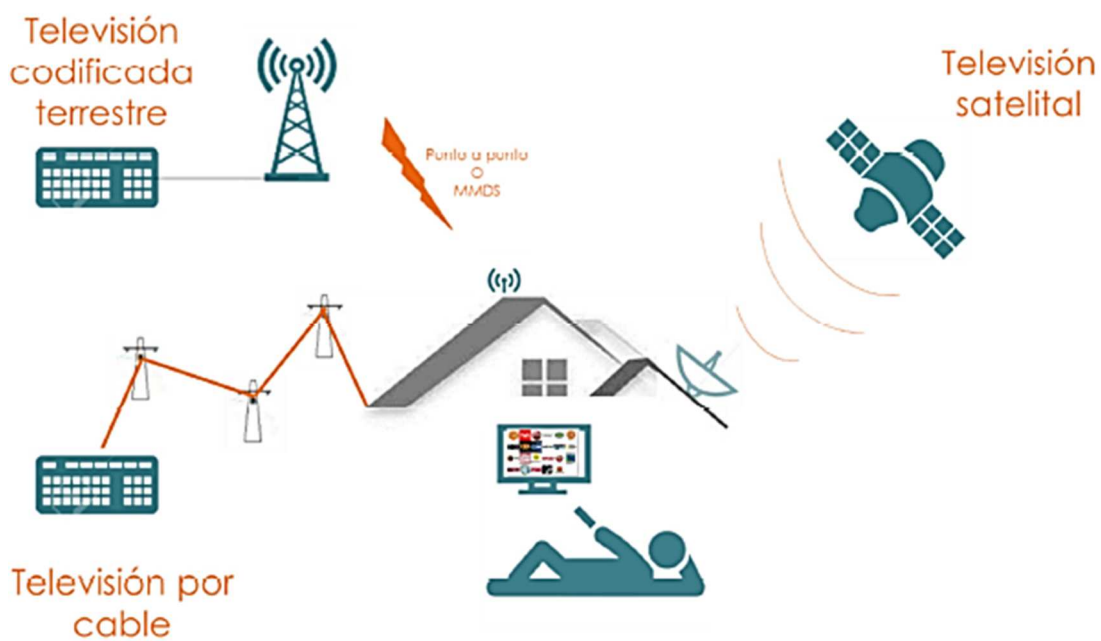
Figura. 1 Modalidades de Servicios de Audio y Video por Suscripción