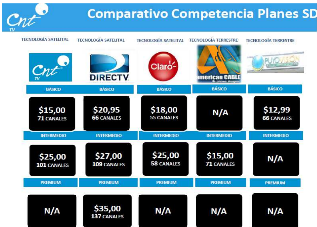
Figura. 11 Comparativo Competencia Planes HD