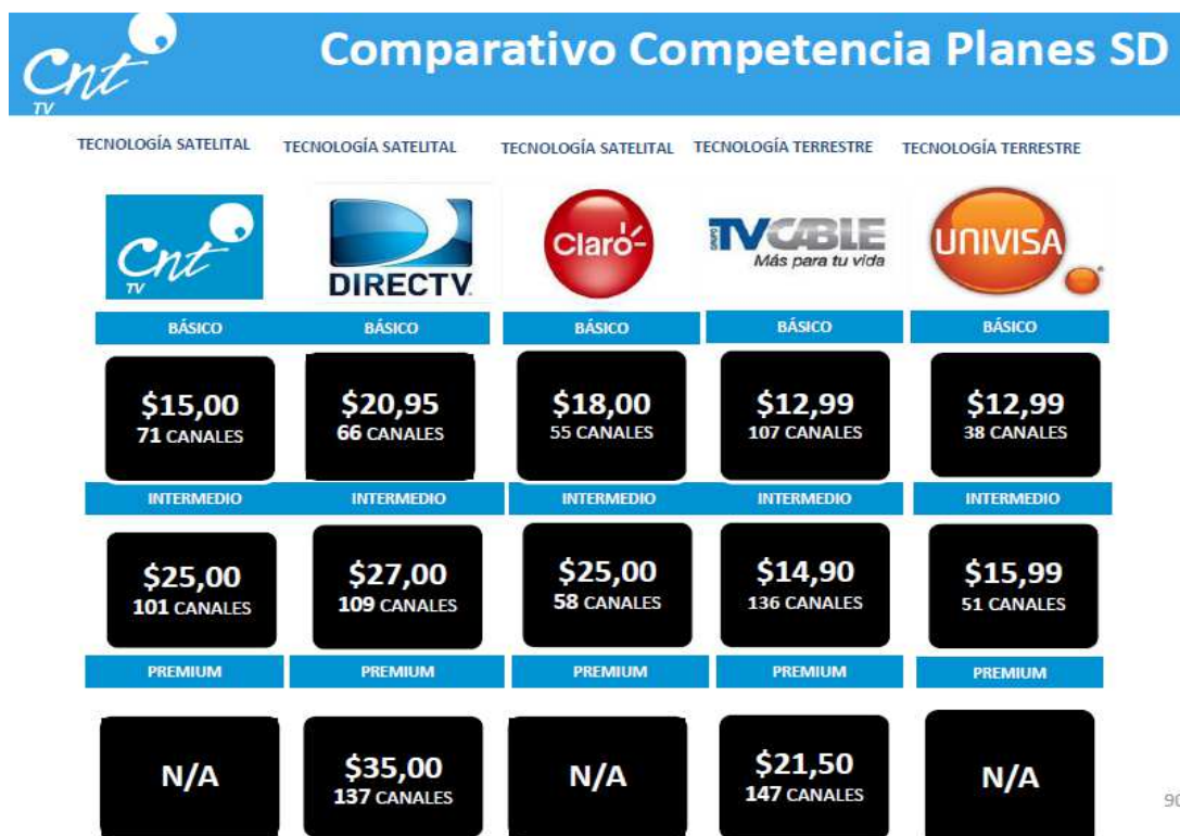
Figura. 10 Comparativo competencia Planes SD