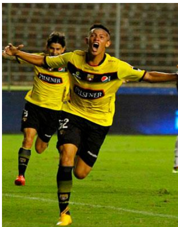
Uniforme titular 2015