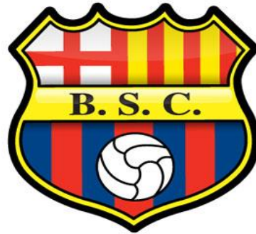
Figura # 2 Escudo del Barcelona Sporting Club