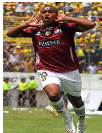
Uniforme alterno 2015