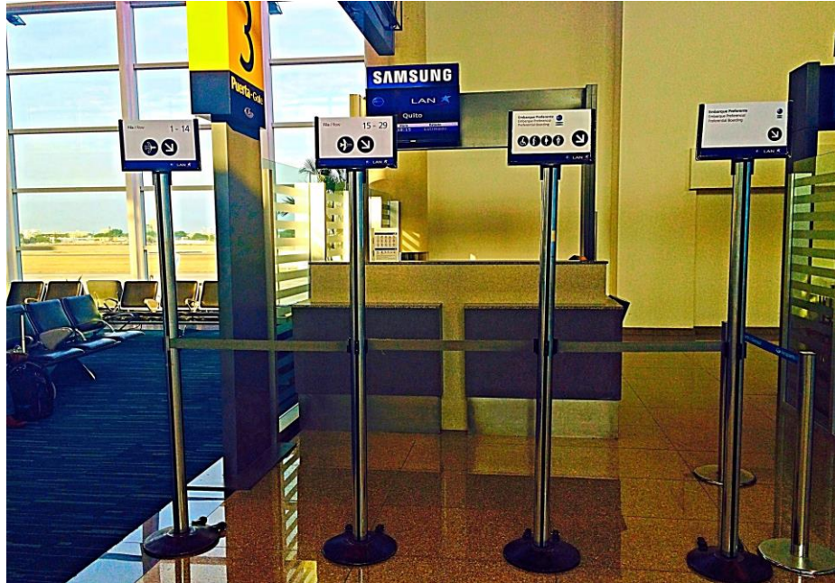
Imagen 4: Señalética LAN dentro de la sala de embarque