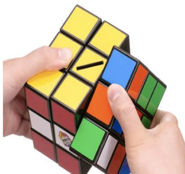
Imagen 8: cubo de rubik anti estrés Imagen 9: pelota anti estrés

Claro que no será una red de internet en el cual se podrá navegar entodas las aplicaciones de su celular o de redes sociales como INSTAGRAM, WHATSAPP, FACEBOOK, TWITTER, YOUTUBE. Esta red contendrá una biblioteca de las películas y canciones que desean observar y oír, parecido a las pantallas que están en los asientos de los aviones de LAN que recorren distancias más largas. Todo esto será para mejorar la percepción del cliente en cuanto al tacto. Para que el pasajero perciba que LAN piensa más allá de las necesidades del consumidor.