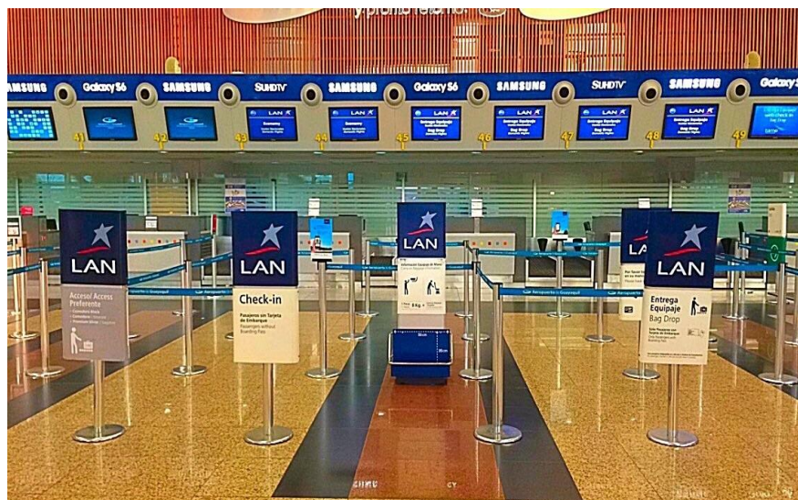
Imagen 3: Mostradores de LAN

Esos momentos en los que no hay nombres en las pantallas el cliente no podrá diferenciar una compañía de otra, para una persona primeriza que recién va a iniciar su proceso de viaje será algo confuso ya que no tiene un punto exacto en el cual pueda identificar alguna empresa para realizar sus preguntas o sacarse la duda. Por esta razón en el estudio se plantea que LAN como empresa se enfoca un poco más en sus clientes que la competencia, desarrollando tácticas más allá que ayudan al cliente en todo su proceso de viaje.