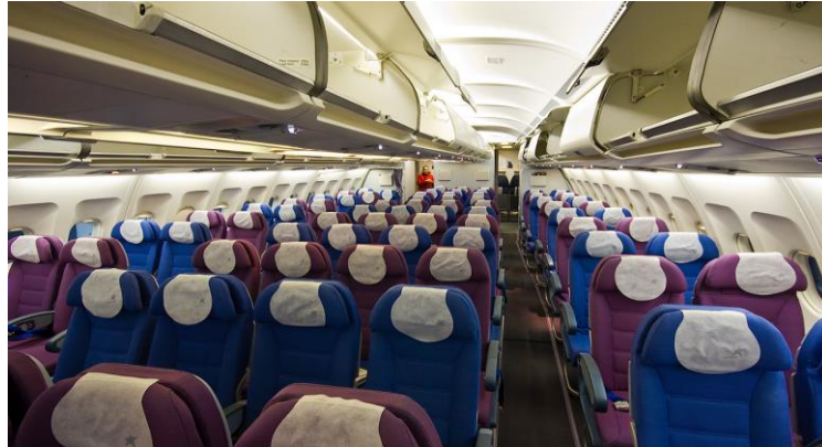
Imagen 6: aviones LAN en el interior