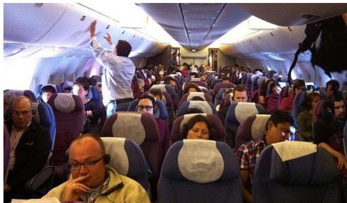
Imagen 7: aviones LAN con pasajeros en su interior