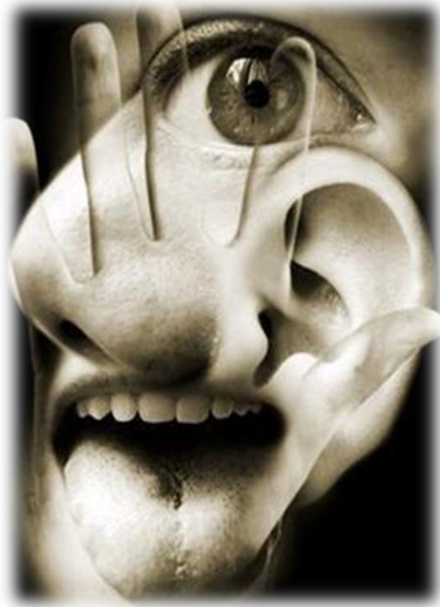
Imagen 2: Los cinco sentidos