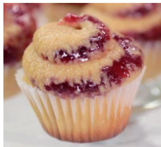
Imagen 10: Demostración de cupcakes

Se podría tomar en cuenta entregar cupcakes o snacks que para el pasajero sería mucho más atractivo que un caramelo. De esta manera el usuario puede ver la diferencia con el de la competencia y percibir que el valor que cancelan por recibir un buen servicio si vale la pena. Hay que tener claro también que la empresa busca lo mejor para sus clientes, pero en este caso vuelos nacionales el tipo de comida no puede ser como el de los vuelos internacionales, por el tiempo de viaje y porque los vuelos nacionales tienen un tiempo más corto de limpieza donde se podría ver afectada la salida de algún vuelo si es que se entregaran tipos de comida más complejos en los que necesite una limpieza más profunda.