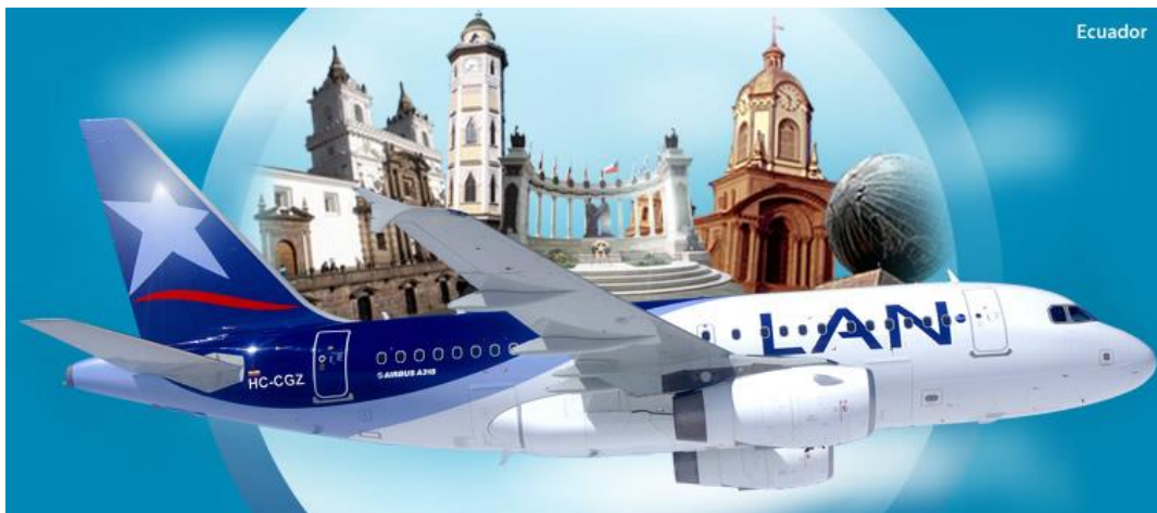
Imagen 1: Lan Ecuador

LAN Ecuador es una aerolínea subsidiaria de LAN Airlines y empezó a ofrecer sus servicios el 28 de abril del 2003 tanto en rutas nacionales como internacionales. Esta empresa ofrece tres diferentes servicios, Premium Business, Premium Economy y Economy, diseñados para los clientes más exigentes y con una gran comodidad y confort en cada uno de los vuelos.(NOTICIAS, 2012)