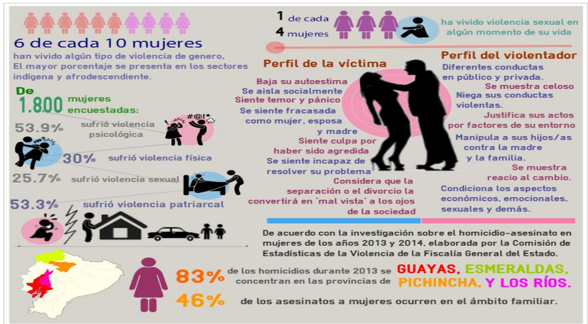
Figura No.3 La violencia de Género en Ecuador