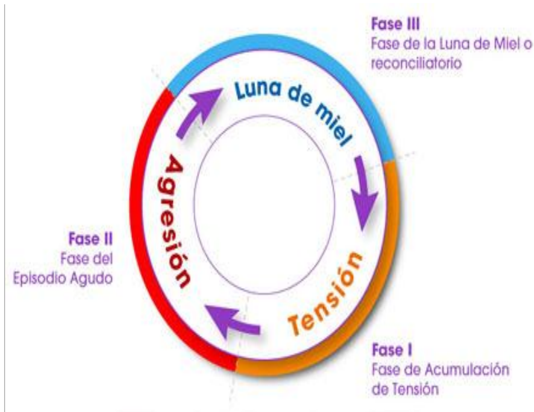
Figura N° 1.Ciclo de la violencia en la pareja