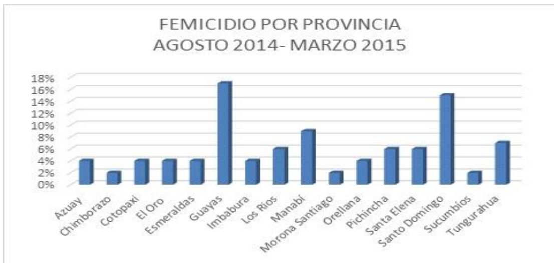
Figura Nº 4 Análisis por Provincia.

Fuente: Dra. Rocío Salgado, I Seminario Internacional de Femicidio (Cuenca 2015)