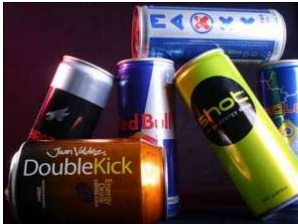
Ilustración 1.- Bebidas Energizantes más consumidas a nivel mundial

Fuente: 25/03/2015 http://www.farmaceuticos.com