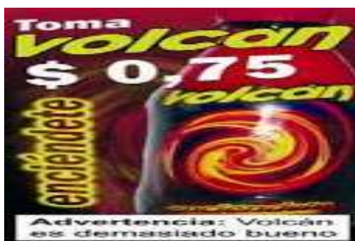
Ilustración 5.- Volcán empieza a emprender campañas publicitarias

La compañía Sumesa S.A. es la segunda empresa ecuatoriana que introdujo al mercado una bebida energizante. En febrero del 2008 Sumesa S.A. lanza al mercado su nuevo producto llamado "Volcán", un energizante a base de taurina (no de cafeína), con una presentación en envase plástico. "Volcán" no tuvo la acogida esperada por los consumidores y la empresa decidió bajar el precio y emprender varias campañas publicitarias.