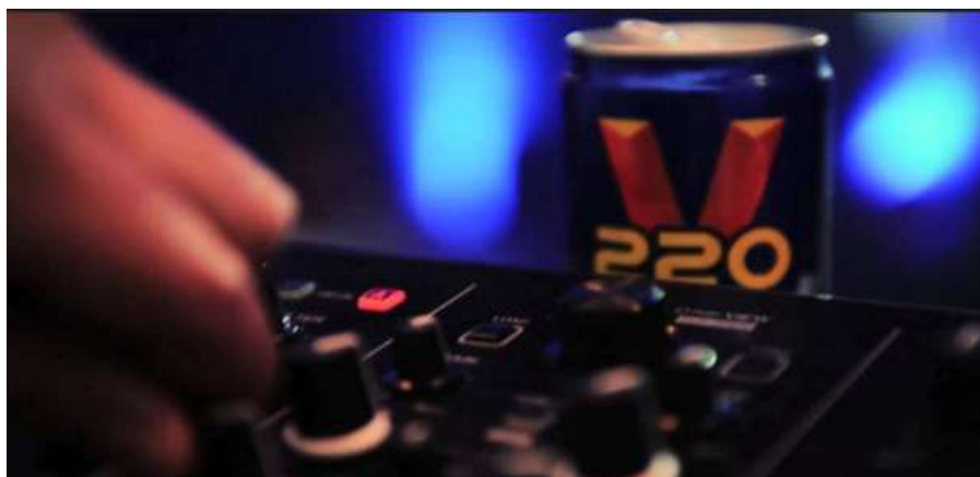
Ilustración 7.- 220V presentación en envase metálico