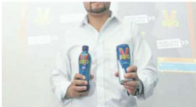
Ilustración 6.- 220V presentación en lata - nueva estrategia de mercado

desarrollado entre enero y marzo del 2014 y en el que se premiaba con un auto deportivo a quien realice más clics sobre un spot de 220V.(Revista Líderes, 2013).