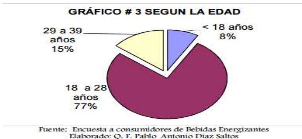
Gráfico 2.- Consumidores de Bebidas energizantes de acuerdo a la edad en Guayaquil.

El estudio reveló que el 33,13% del total de la muestra son consumidores de bebidas energizantes, lo cual es un valor muy alto ya que el segmento lo comparte con bebidas gaseosas azucaradas tradicionales y bebidas hidratantes naturales (agua, jugos, té).