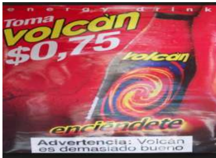
Ilustración 8. -Bebida energizante Volcán y su estrategia de bajo precio.

Marcas como Volcán compiten con estrategias de precios, sin embargo no invierten mayormente en campañas publicitarias, ni tienen presencia en las redes sociales.