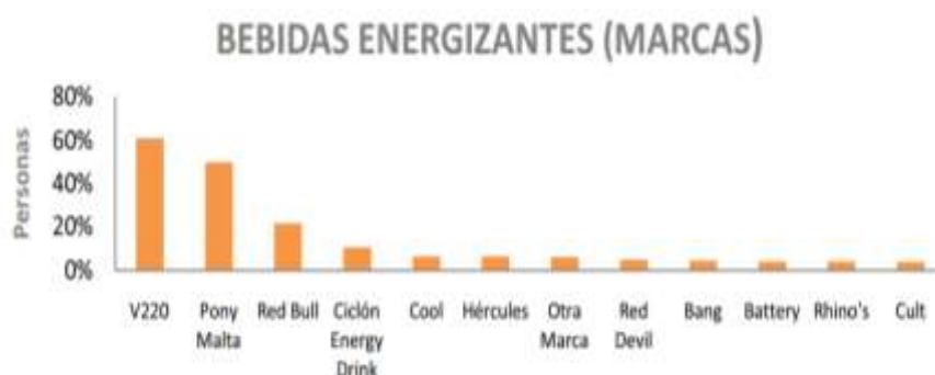
Gráfico 4.- Posicionamiento de las bebidas energizantes por marca en Guayaquil

V220, esta es una bebida energizante de fabricación local que trata de simular o emular las propiedades de la bebida Red Bull (sabor y efectos) pero con la drástica diferencia en su valor, ya que el V220 tiene un costo de $1,00 ctvs. A diferencia de Redbull cuyo costo es de $2,32 ctvs.