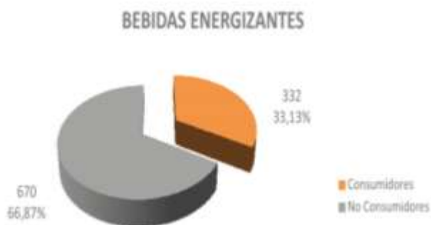
Gráfico 1.- Posicionamiento de las bebidas energizantes en Guayaquil