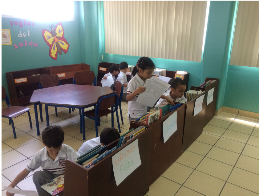
Buscando el cuento (Parte 1). Perrazo, M. (2015)