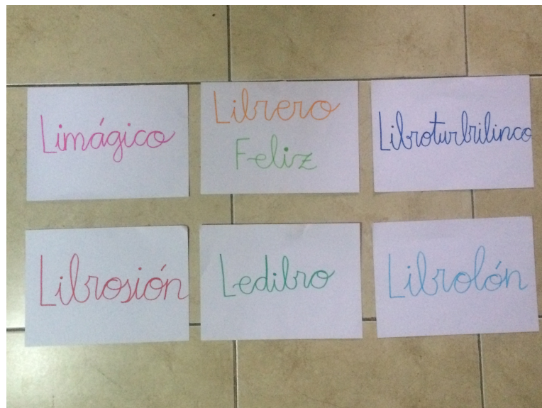
Rotulación Creativa. Perrazo, M. (2015)