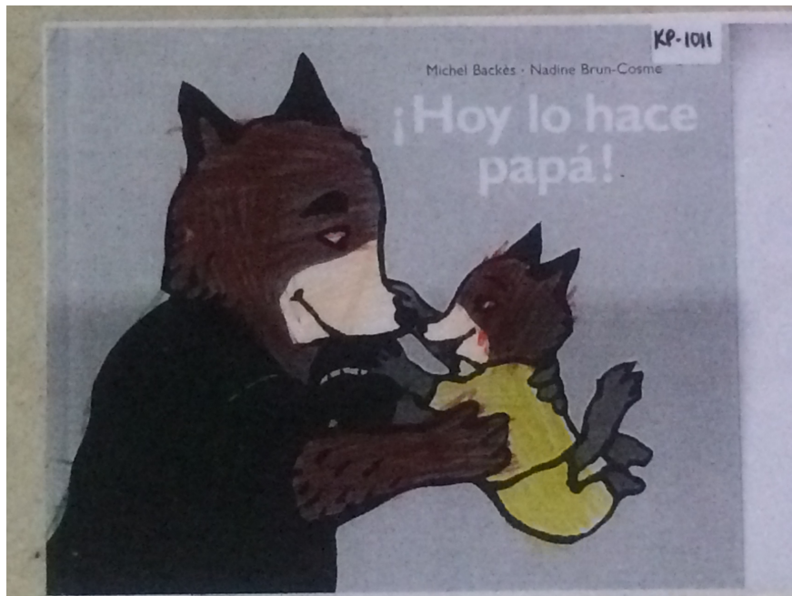
Buscando el cuento (Parte 1). Perrazo, M. (2015)