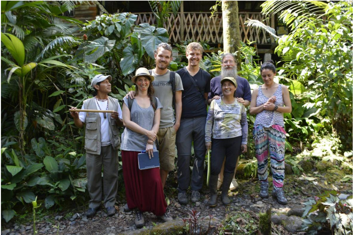
Parque Etnobotanico Omaere