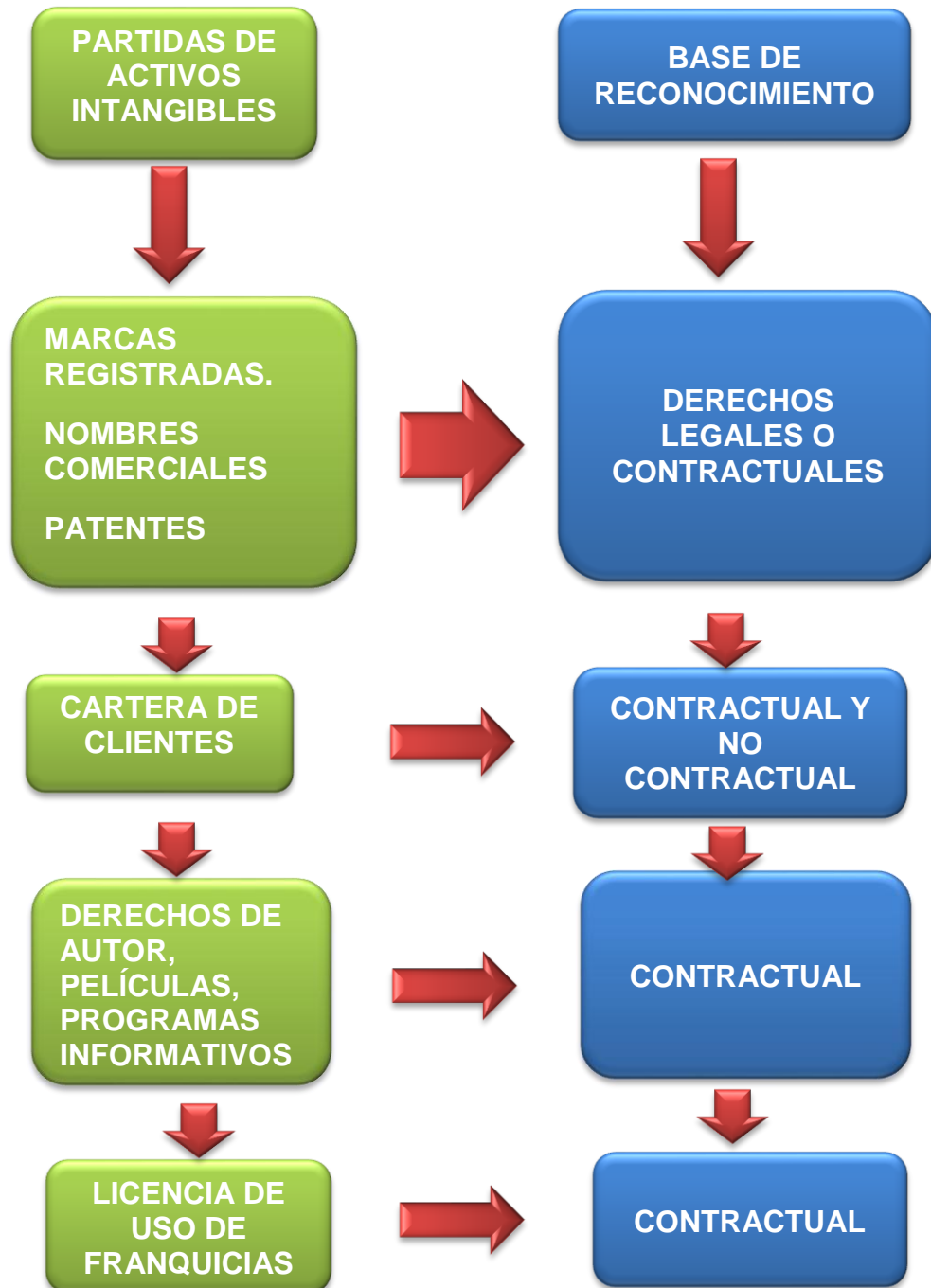
GRAFICO 3. Activos intangibles mediante su reconocimiento.