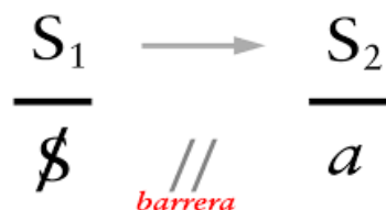
Figura 3 Discurso del Amo

Por tanto, el lazo social es el lugar donde el sujeto intenta hacerse reconocer a través de significantes que lo nombran y lo ubican; pero ese reconocimiento está estructuralmente atravesado por la falta y por la inconsistencia del Otro (Piasek & Paragis, 2019, p.687). Sin embargo, el cuerpo no es sólo imagen para el Otro: es también el punto donde irrumpe un goce que excede toda identificación y muestra el límite del lazo basado en el ideal (Lacan, 1970). El psicoanálisis, en este marco, busca acompañar la invención singular de un modo de lazo que bordeé lo real del goce y permita al sujeto situarse en el campo del Otro sin quedar totalmente capturado por los imperativos del discurso (Miller, 2011, p. 122).