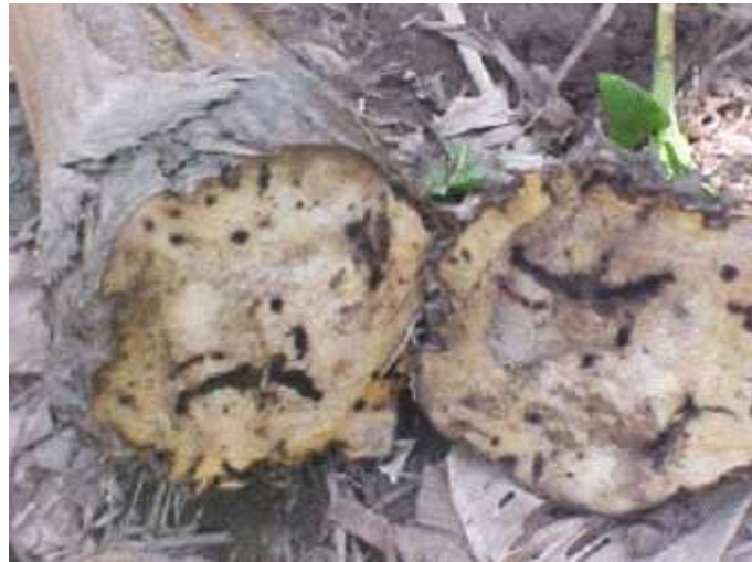
Figura 11: Daños causados por Nematodos y Picudos Negros Juveniles