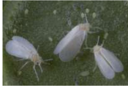
Figura 5: Mosca Blanca Bemisia tabaco