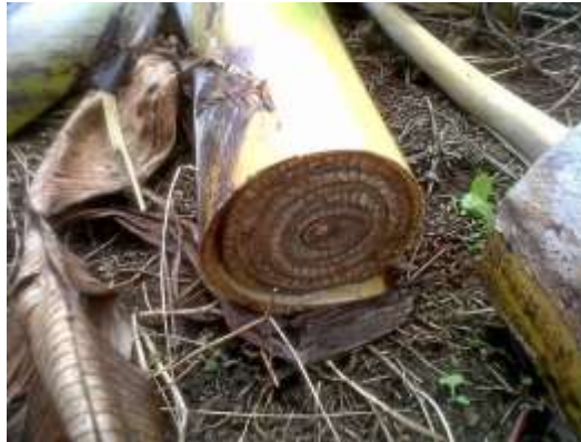
Figura 12: Fusarium sp

aplicaciones de altas cantidades de fertilizante nitrogenado del cual se nutren de un modo más acelerado que el mismo cultivo, causando daños significativos que causan perjuicios económicos graves al productor.