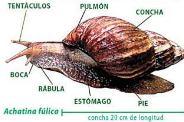
Figura 2: Morfología Caracol Africano Achatina fúlica :