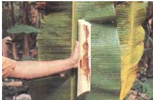
Figura 14: Bacteriosis por Erwinea