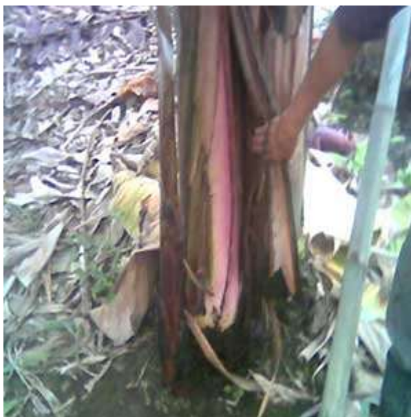
Figura 15: Bacteriosis por Ralstonia (moko)

En el manejo de enfermedades fungosas como fusarium y sigatoka aplicamos fungicidas de etiqueta verde que fueron Phyton de Ecuaquimica en dosis de 3 cc por litro, este es un sulfato de cobre pentahidratado de gran sistemia y con un gran efecto bactericida que controlo muy bien Erwinea y Metil tiofanato al 70 % (Topsin o Tiofin) 200 gramos por tanque de 200 litros que ofreció mejor rango contra ralstonia y que controla muy bien ataques de hongos. El metil tiofanato y Sulfato cobre penta hidratado ofrecen como ventaja que potencializan el uso de abonos foliares porque favorecen la apertura de estomas del cultivo, un abono foliar de buena calidad aplicado en conjunto ofrece una poderosa ayuda para romper momentos de estrés causados por enfermedades y plagas. En nuestro ensayo usamos Kristalon de Yara y Urfus de Fertiandino.