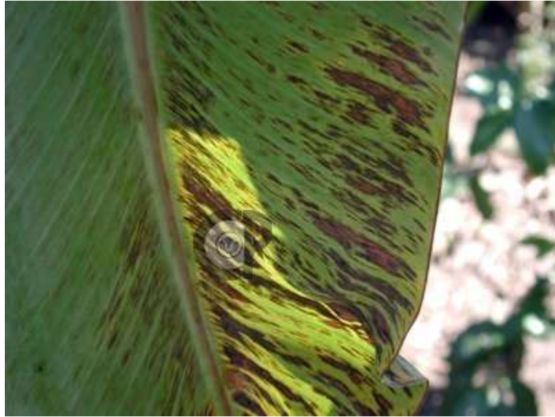
Figura 13: Sigatoka