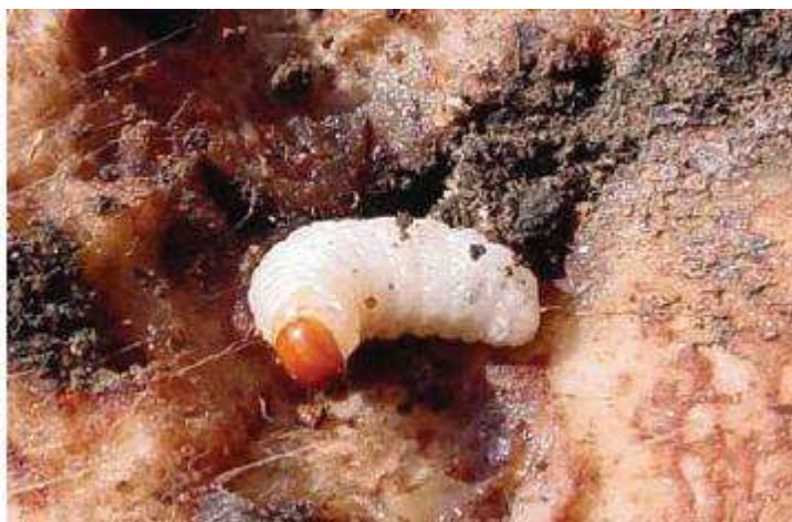
Figura 9: Juvenil de Picudo Negro