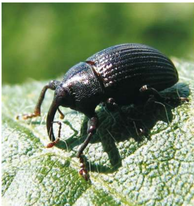
Figura 8: Picudo Negro Adulto