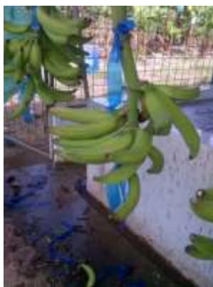
Figura 7: Danos en fruta por Trips