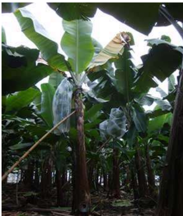
Figura 16: Virosis BSV

Virosis.- Enfermedades causadas por especies virales transmitidas por individuos vectores, tiende a confundirse continuamente con síndrome de bacteriosis pero a diferencia de la bacteriosis, la virosis no produce pus es decir no se da ese cuadro de pudrición con fuerte olor ácido propio de descomposición bacteriana patógena., y esta no se cura pero se trata con un elevado balance nutricional y manteniendo a régimen moderado la infección de vectores, las plantas con virosis y bacteriosis muestran síntomas similares en cuanto a la apreciación visual que muestra una muerte descendente.