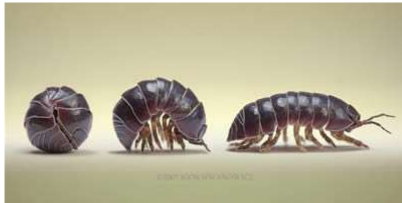
Figura 4: Cochinilla Dactylopius coccus

no lo tenemos es un riesgo enorme ya que se hospeda en la parte radicular y foliar del cultivo, además de instalarse en la fruta en el área del pezón de la misma esto ocasiona daños mecánicos al cultivo y la fruta además de actuar como un agresivo vector de enfermedades, se hace presente a lo largo de la vida de las plantaciones sin distinguir épocas seca o lluviosa siempre se asocia con la presencia de hormigas que viven a expensas de sus fluidos corporales que son dulces y apetecibles para las mismas, entro en el mismo rango de controles de plagas que el caracol africano y sus controles como vector fueron muy eficientes.