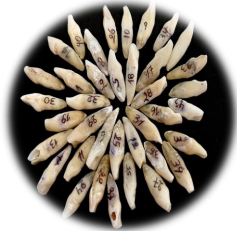
Imagen 1. Incisivos centrales inferiores enumerados

Para la desinfección y limpieza de restos orgánicos de los incisivos fueron sumergidos en hipoclorito de sodio al 2,5% durante tres horas, luego fueron lavados con suero fisiológico y secados al aire libre. Después, se enumeró con marcador permanente del 1 – 40.