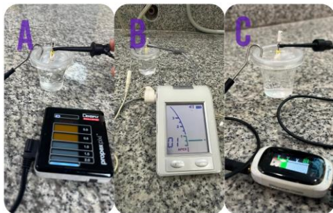
Imagen 4. (A) Proper Pixi mini, (B) Root ZX Morita, (C) AirPex mini

Se hizo dos orificios en la parte de la tapa para sumergir tanto al diente como al gancho labial en la solución salina y así proceder empezar con el experimento. Después se elaboró una hoja de registro de datos con las diferentes variables a estudiar. Se inicia con el experimento usando los tres tipos de localizadores: Proper Pixi mini, Root ZX Morita Dentsply y AirPex mini Eighteeth. Así mismo, se usó dos tipos de material de limas: Niquel-Titanio Maillefer n15 de 25mm y lima de Acero Inoxidable C-pilot de VDW n15 de 25mm que se realizaba este procedimiento por cada diente. (Imagen 4).