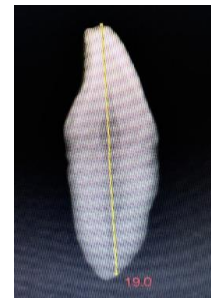
Imagen 3. LT medida con programa EasyDent V4 Viewer - Measure

Se tuvo como punto de referencia el borde incisal del diente fijada con el tope de goma de la lima. Para la simulación de la cavidad oral se usó un envase para salsas de plástico pequeño con tapa, donde se llenó con solución salina al 0,9% ya que se aproxima a las condiciones y propiedades de la cavidad bucal por sus solutos.