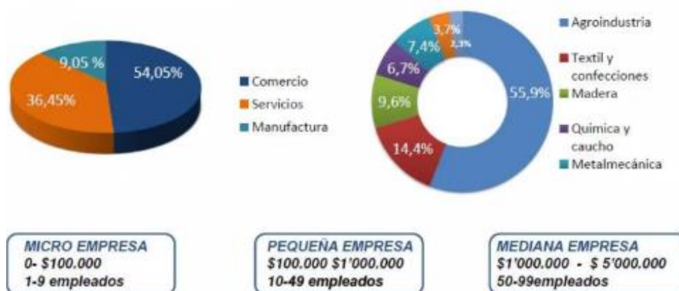
Figura 1 Caracterización PYMES

Nota: Adaptado de https://www.slideshare.net/slideshow/las-pymes-y-su-importancia-para-el-ecuador/158219497#8