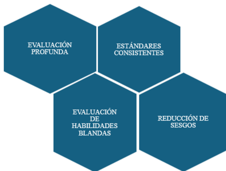
Figura 5 Objetivo de las Entrevistas Semiestructuradas

Nota: Adaptado de https://www.grupocastilla.es/entrevista-semiestructuradas/ Elaboración del Instrumento Guía para la Entrevista