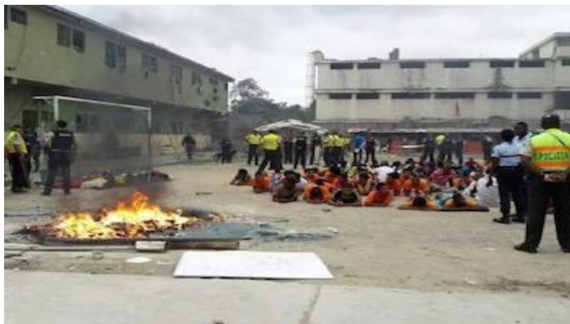
Figura 1 Cárceles del Ecuador.