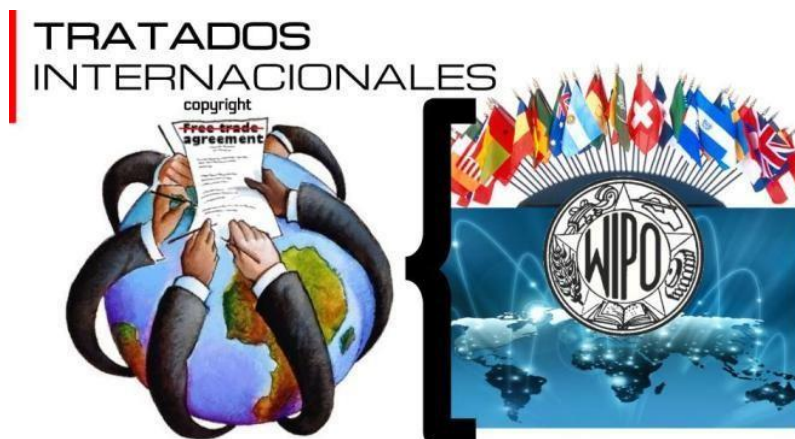
Figura 3 Tratados internacionales