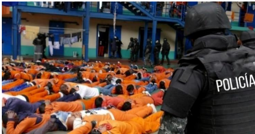
Figura 2 Hacinamiento en las cárceles del Ecuador.