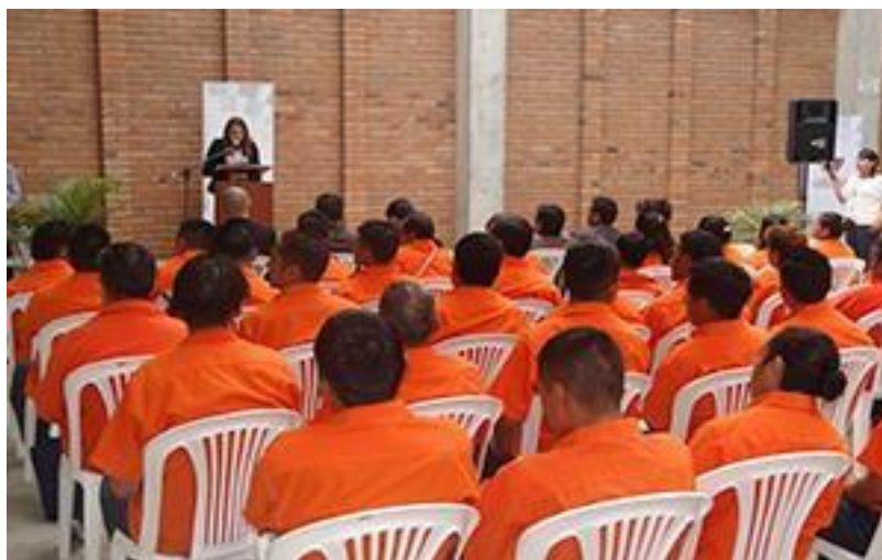
Figura 4 Personas Privadas de la Libertad