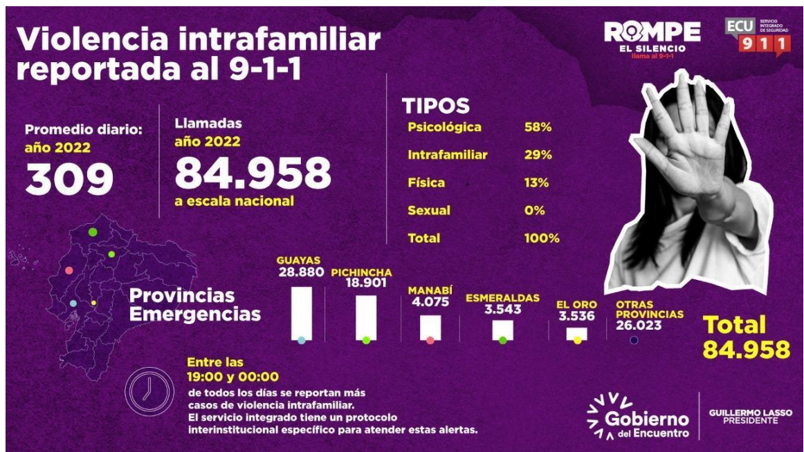
Estadística de violencia familia