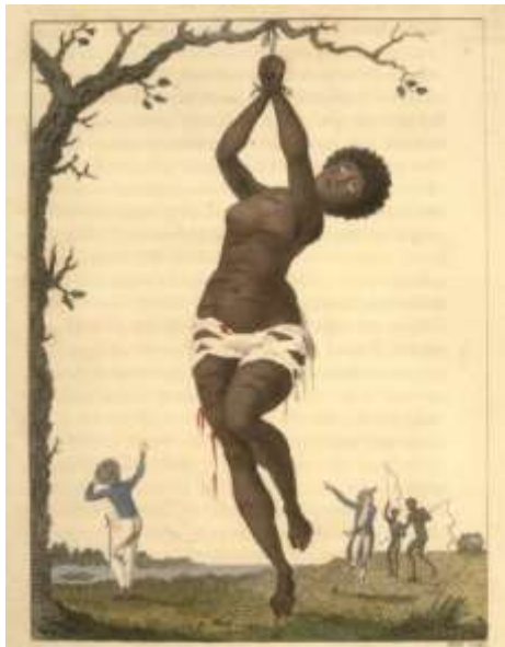
Ilustración de John Gabriel Stedman

Nota: Ilustración de mujer afroamericana azotada como castigo. Extraída de La Trata de Esclavos de África: el mayor genocidio de la historia humana (2019).