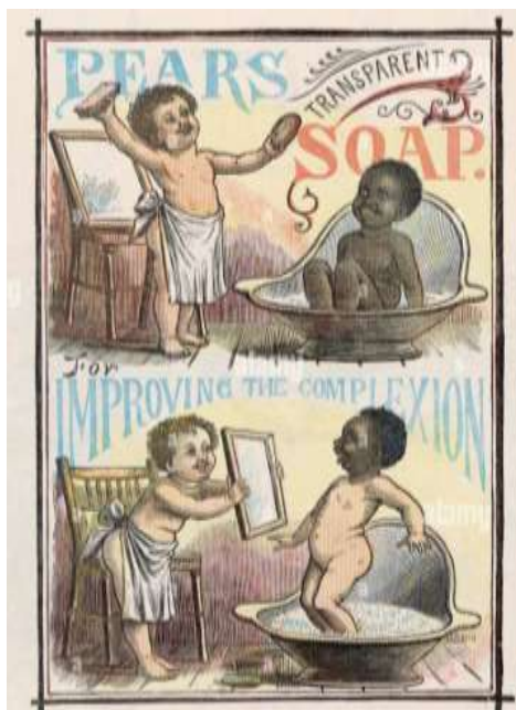
Anuncio de jabón Pears (1885)