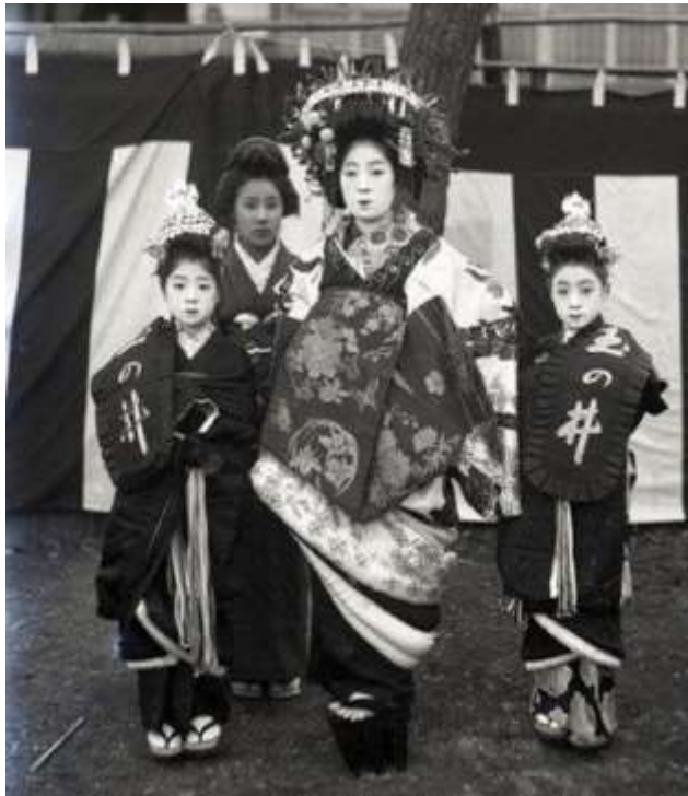
Figura 1 Oiran y aprendices (shinzō)

Nota: La palabra "oiran" está formada por dos kanjis que significan "flor" y "primero", lo que enfatiza su exclusividad y el nivel de categoría frente a otras profesiones, Díaz (2017).