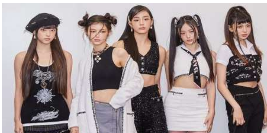
Grupo de K-pop New Jeans

Nota: New Jeans, banda femenina surcoreana del sello ADOR. Las edades de sus integrantes oscilan entre los 14 y 18 años.