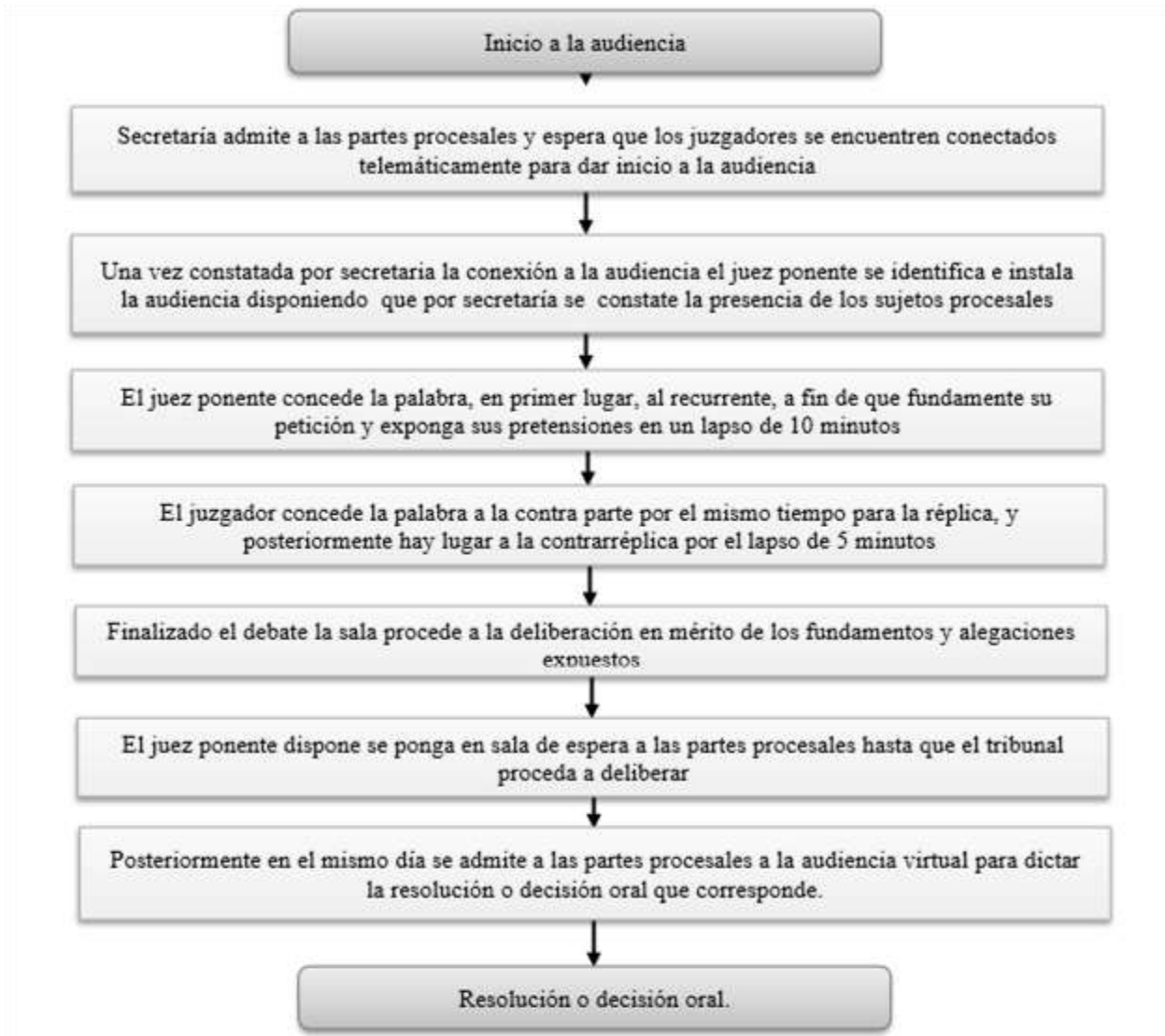
Diagrama de flujo del desarrollo de una audiencia virtual