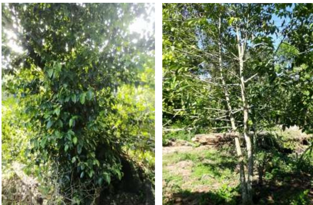
Foto de los cultivos de la familia Lanza, agricultores y comerciantes de Guayusa de la zona, Comuna Pamiwa.

Cultivar la Guayusa cerca de árboles maderables en peligro de extinción, cultivos de alimentos, cacao, café y otras plantas locales, ayuda a mantener la integridad ecológica de la selva, mientras que ofrece una variedad de fuentes de ingresos para los agricultores indígenas, esto significa que la guayusa provee un incentivo económico a los granjeros a mantener la selva intacta, a diferencia de los otros sembríos que requieren que otros árboles sean cortados.