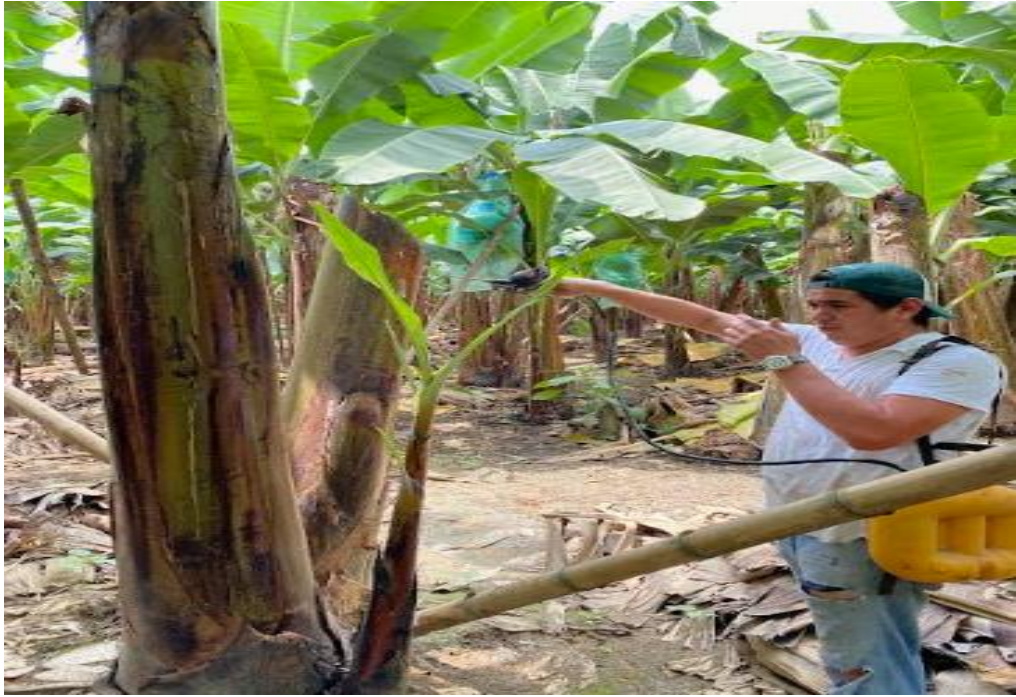
Aplicación del producto