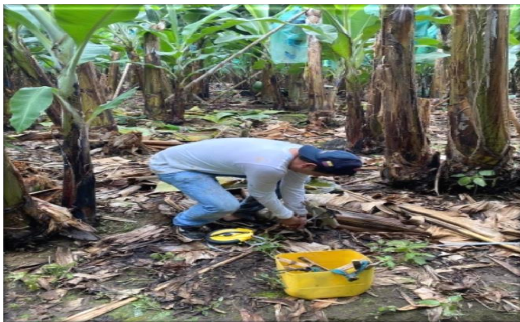
Delimitación de las parcelas