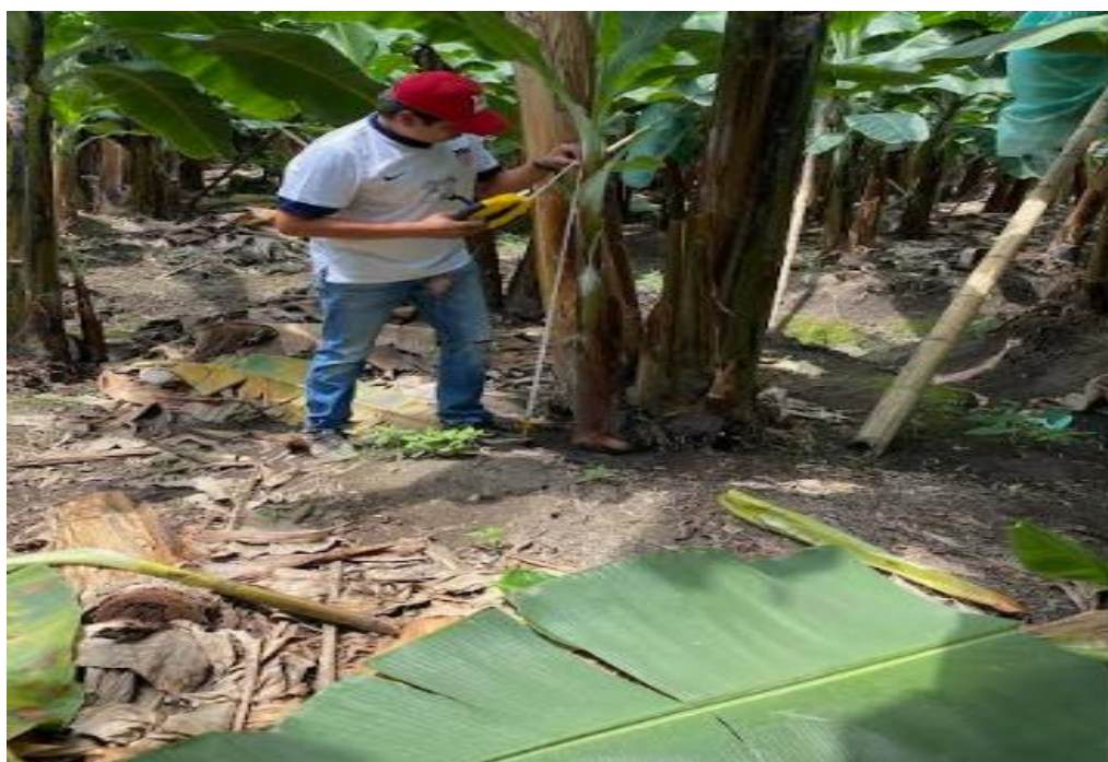
Toma de datos