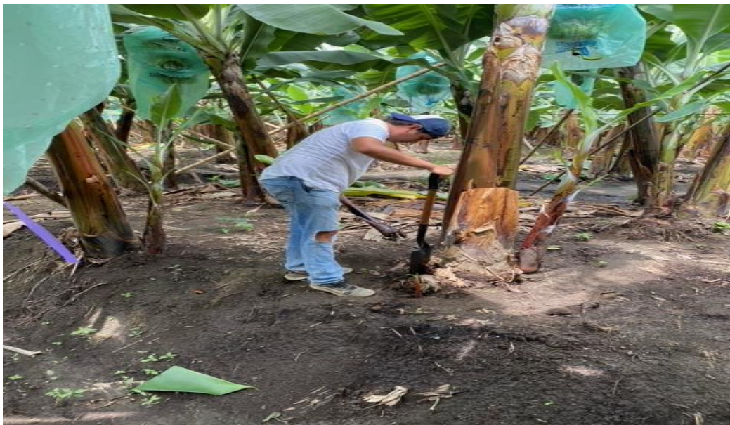
Toma de datos