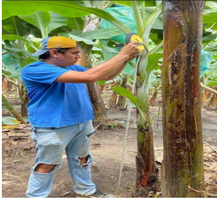
Toma de datos