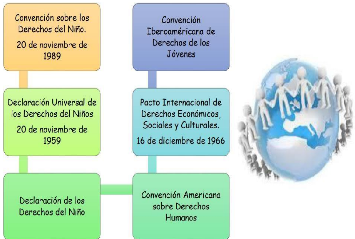
Grafica No. 3: Tratados internacionales ratificados por el Estado ecuatoriano.

Para mejor comprensión de los tratados internacionales que están ratificados por el Estado ecuatoriano en relaciones a los niños y adolescentes, se los mostrara a través de la siguiente grafica a continuación: