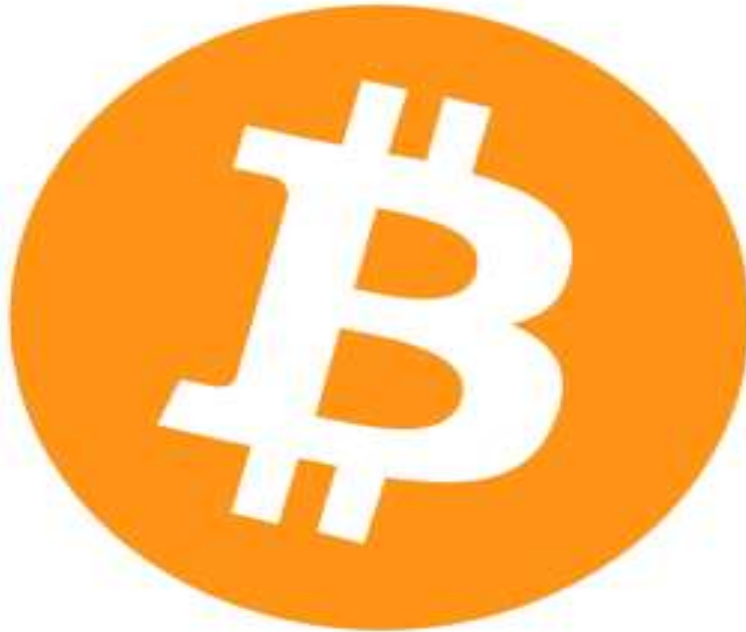
Figura 7 Logotipo de Bitcoin.

Este tipo de redes forma parte de la primera generación de Blockchain , y la primera aplicación de esta tecnología se dio con Bitcoin.