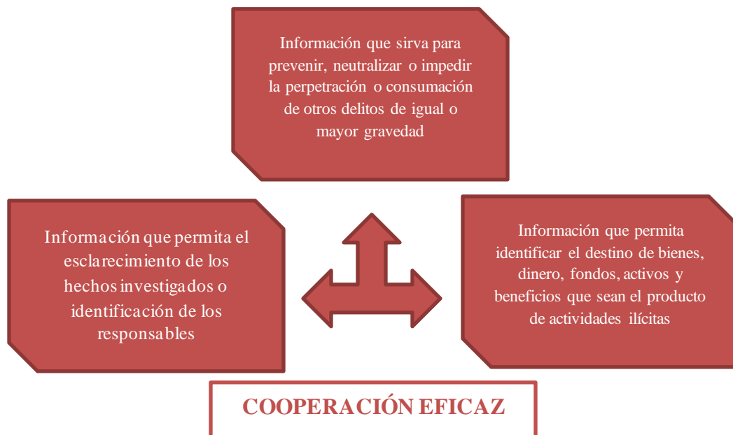
Ilustración 1. Definición de la Cooperación Eficaz

La normativa penal vigente permite aplicar la cooperación eficaz en tres casos: 1) Cuando el cooperador entregue información precisa, verídica y comprobable que ayude a resolver el caso investigado o las personas participantes en el ilícito; 2) Cuando el cooperador entregue información precisa, verídica y comprobable que ayude a prevenir o impedir la consumación del acto ilícito u otros de igual o mayor gravedad que el que delata; y, 3) Cuando el cooperador entregue información precisa, verídica y comprobable que ayude a detectar dónde se encuentran los bienes que son producto de ilícitos (Asamblea Nacional del Ecuador, 2014).