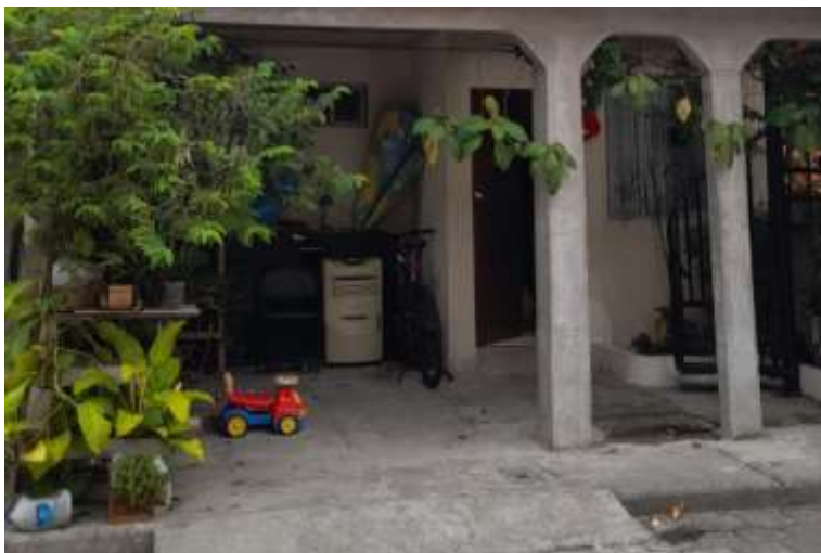
Fotografía de la Locación Casa Padres de Leonardo

Dirección: Mucho Lote Etapa 5, Avenida 11 a , Peatonal 12 a .