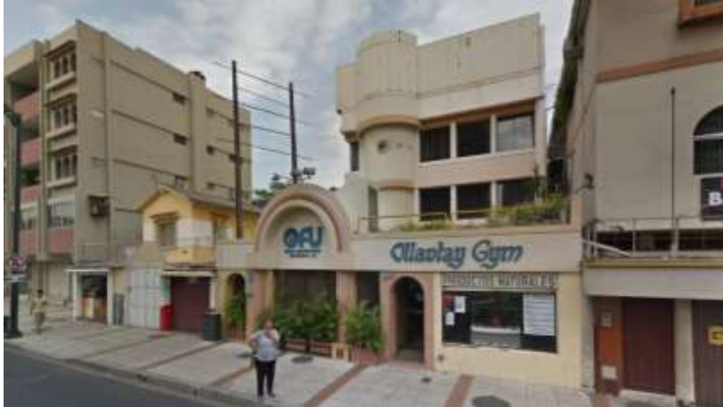
Fotografía de la Locación Salón de Danza