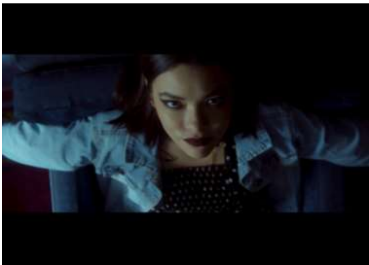
Fotograma del Trailer de La Mirada Cadente