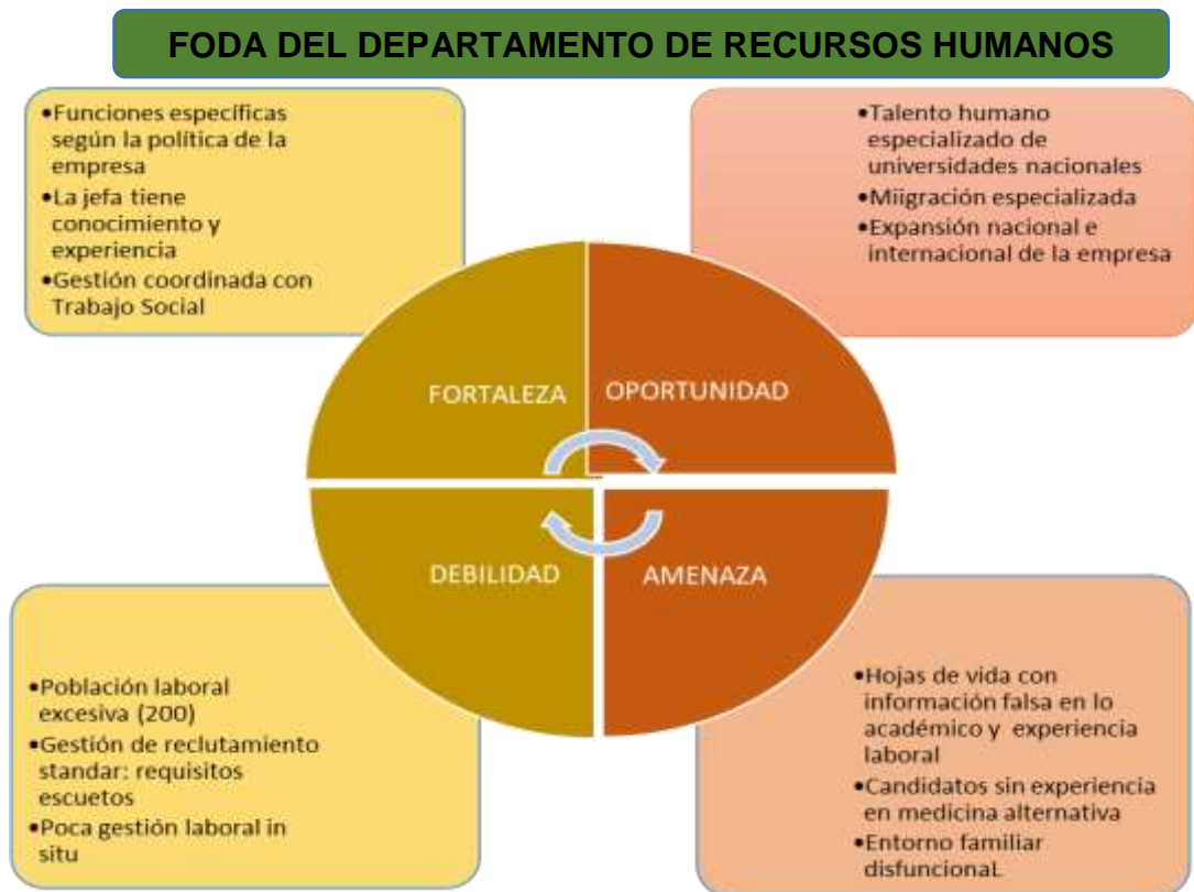
Gráfico 2. FODA del departamento de recursos humanos