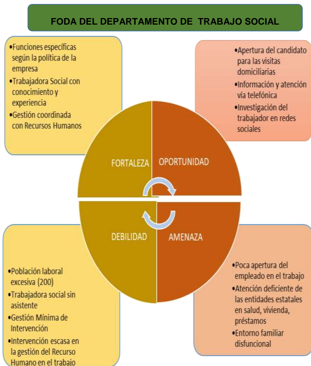
Gráfico 3. FODA del departamento de trabajo social