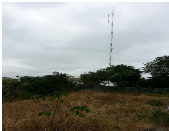
Figura 3. 2: Sitio de trabajo de campo

Los impactos sobre el medio socioeconómico son de bajo a moderado volumen e importancia y están asociados con eventos permanentes de la operación entre los que se incluye la generación de radiación electromagnética, ruido temporal, descargas eléctricas, movimiento de vehículos en actividades de mantenimiento y control, que podrían afectar a la población del área. A continuación vemos las figuras 3.2 y 3.3 del sitio de trabajo de campo.