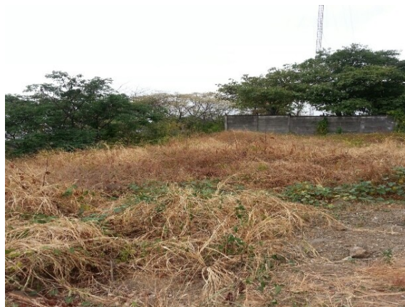
Figura 3. 3: Sitio de trabajo de campo