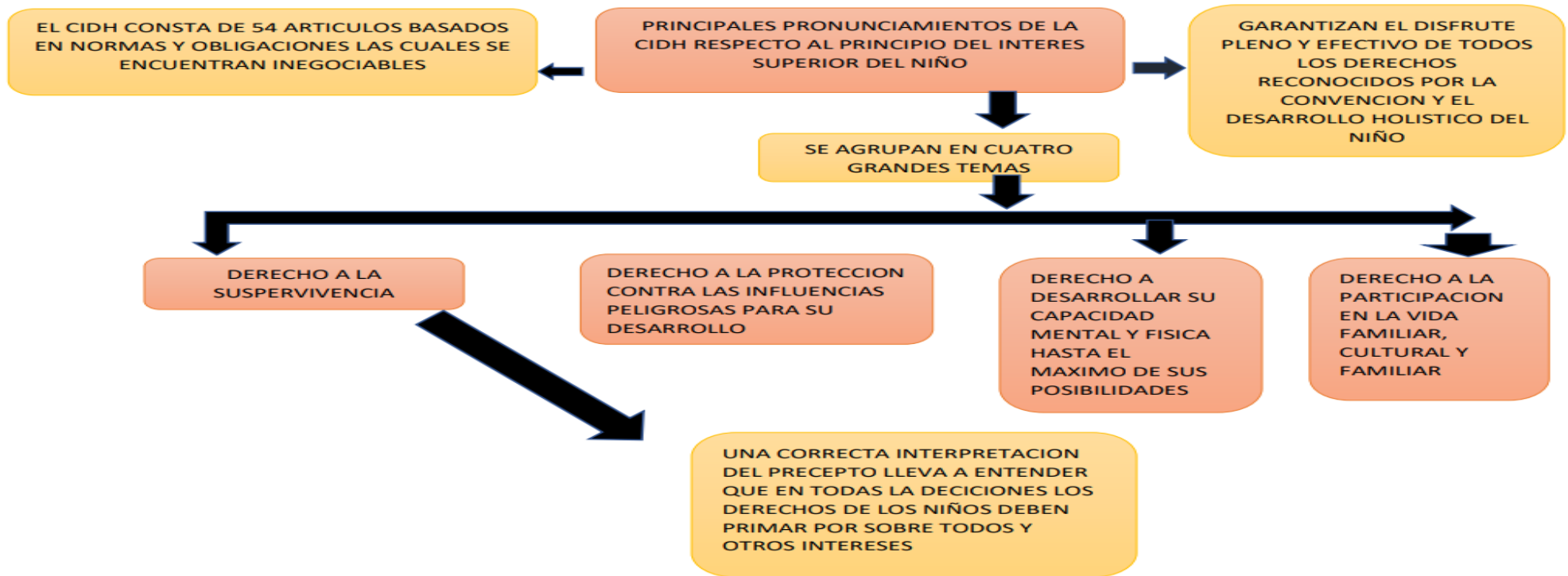
Gráfico # 4: Principales pronunciamientos de la CIDH.