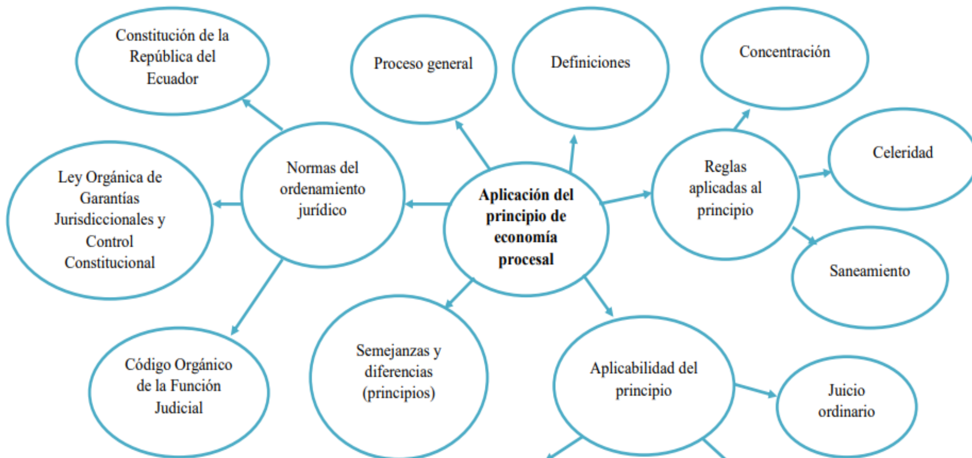
Gráfico # 3: Principio de Economía Procesal