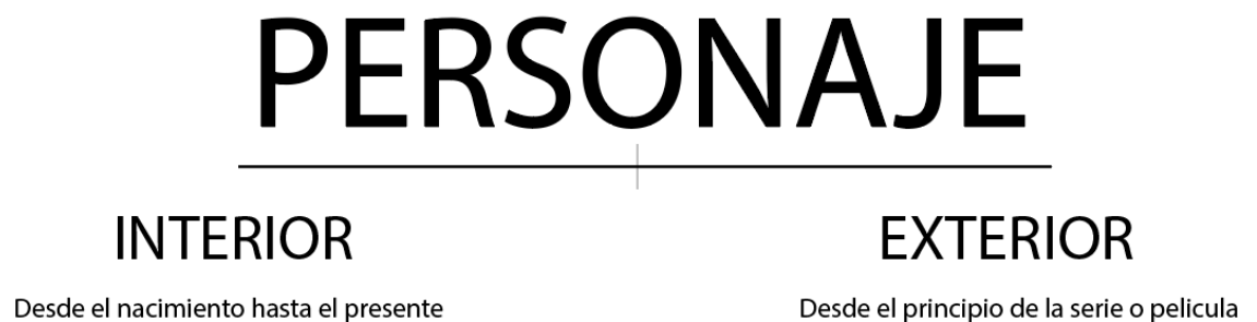
FIGURA 1. DIAGRAMA DEL PERSONAJE (FIELD, 1979)

De acuerdo a Field (1979), para crear un personaje, primero hay que asignarle un protagonismo en la historia, separar componentes de su vida en dos categorías, interior y exterior. La vida interior se desarrollará desde el nacimiento del personaje, hasta el momento en el que comienza la película, la vida exterior se desarrolla desde el momento que inicia la película, hasta que concluye (Field, 1979).