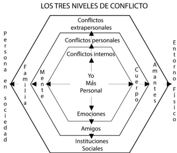
Figura 4. Niveles de conflicto (Mckee, 1997).

De acuerdo a Mckee (1997), el personaje al perseguir sus metas que están más allá de alcance, realiza acciones consciente o incipientemente, motivado por un sentimiento o pensamiento del protagonista, pero al realizar estas acciones, entra a un abismo de expectativa y de resultado, que hacen que afecte de manera positiva o negativa en el entorno del personaje.