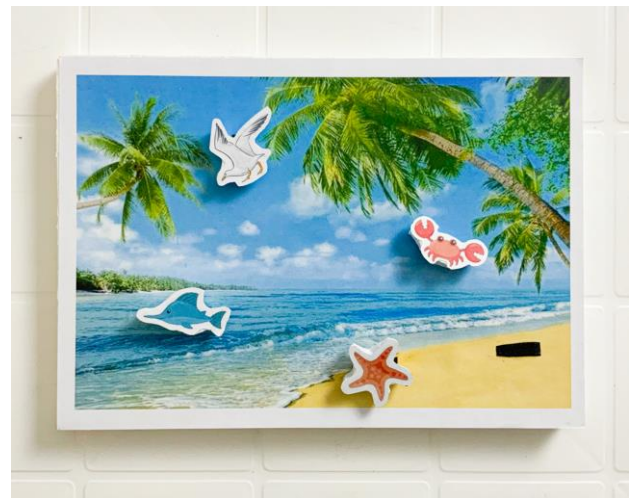
Ubicando animales en su hábitat

Fuente: Actividades didácticas realizadas a mano.