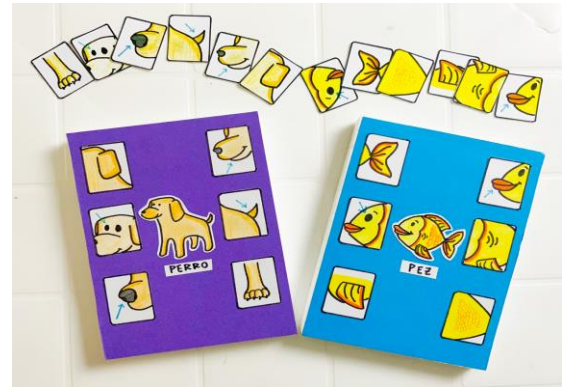
Emparejamiento de objetos visuales