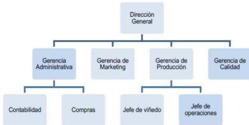
Figura 1: Organigrama Viña San Bartolomé

De acorde con la figura 1 podemos visualizar que la estructura que tenía la Viña San Bartolomé dentro del esquema departamental que el área de tenía más peso era la gerencia general. Este tipo de estructura se definen por ser obsoletas y simples.