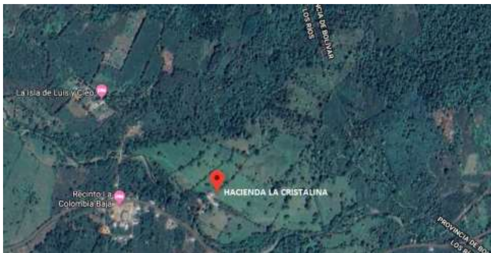
Gráfico 1. Ubicación geográfica Hacienda la cristalina

El trabajo se llevó a cabo en la Hacienda La Cristalina, ubicada en el reciento Colombia Baja, Parroquia San José del Tambo, Cantón Chillanes, Provincia de Bolívar. Se encuentra ubicado geográficamente a -2.064726 de latitud y -79.231393 de longitud a una altitud de 3 295 msnm.