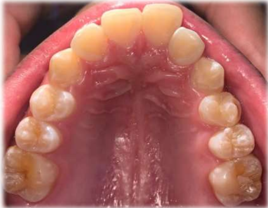
Imagen 4. Hipomineralización incisivo molar moderada, con opacidades en el esmalte y fractura posteruptiva en una superficie en el primer molar superior izquierdo.

Imagen 3. Hipomineralización incisivo molar leve, con opacidades en el esmalte definidas y aisladas, de color marrón en los primeros molares superiores.