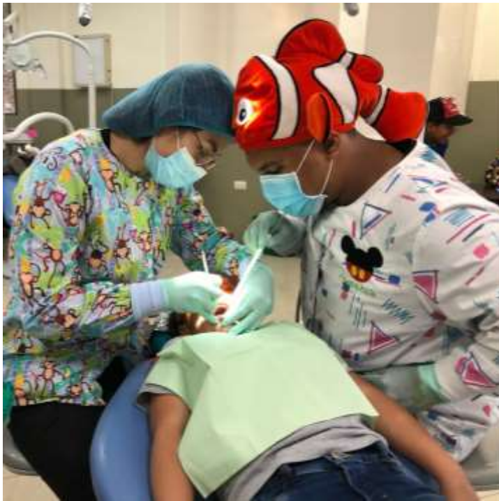
Imagen 2. Prueba de hipersensibilidad colocando una bolita de algodón con endoice en el tercio medio de las piezas afectadas con HIM.