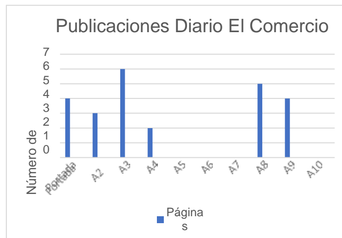
GRÁFICO 4. UBICACIÓN DE LAS PUBLICACIONES DE DIARIO EL COMERCIO.