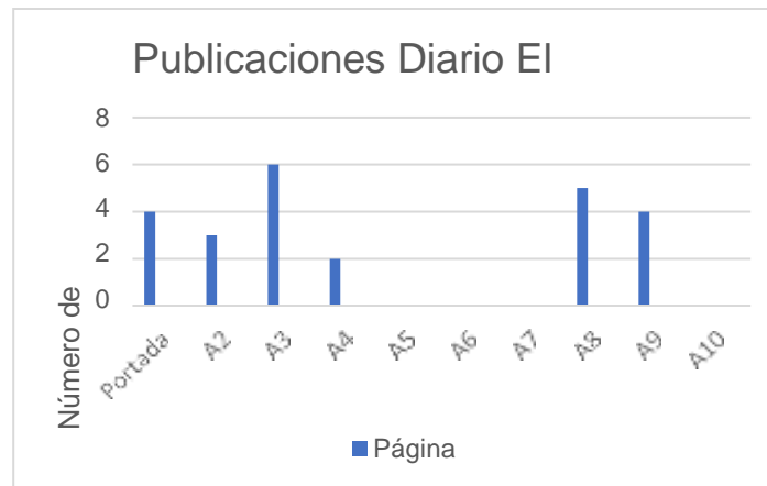
GRÁFICO 3. UBICACIÓN DE LAS PUBLICACIONES DIARIO EL UNIVERSO.