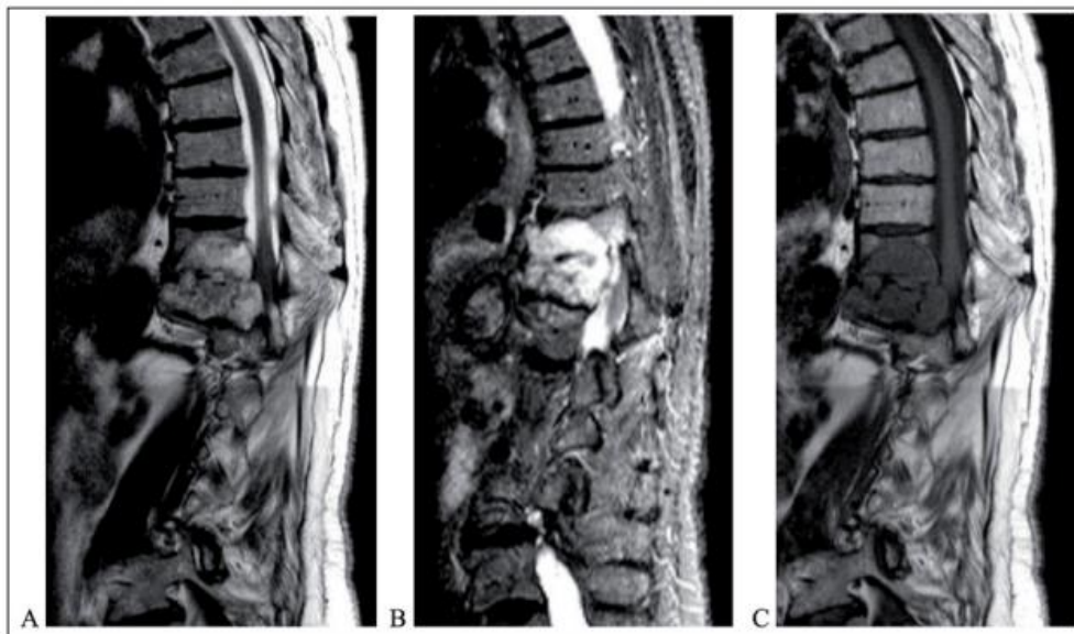
Figura 1. Metástasis vertebrales en D10 y D11: RM estándar. A: imagen de RM sagital potenciada en T2 que muestra un depósito metasasico relacionado con un carcinoma de tiroides. B: imagen de RM sagital potenciada en STIR. C: imagen de RM sagital potenciada en T1.

La tomografía computarizada muestra detalles óseos sobre la extensión de la destrucción ósea por la metástasis, la invasión cortical y la clasificación intralesional. Es la mejor prueba que existe para la valoración del grado de alteración de la estructura ósea. Mientras que la resonancia magnética ha demostrado su utilidad en varios aspectos importantes (figura 1). Constituye un método fiable para la valoración de la extensión de las metástasis en hueso medular y es la mejor técnica para delimitar su extensión a partes blandas y su relación con las estructuras neurovasculares y los tejidos adyacentes (14).