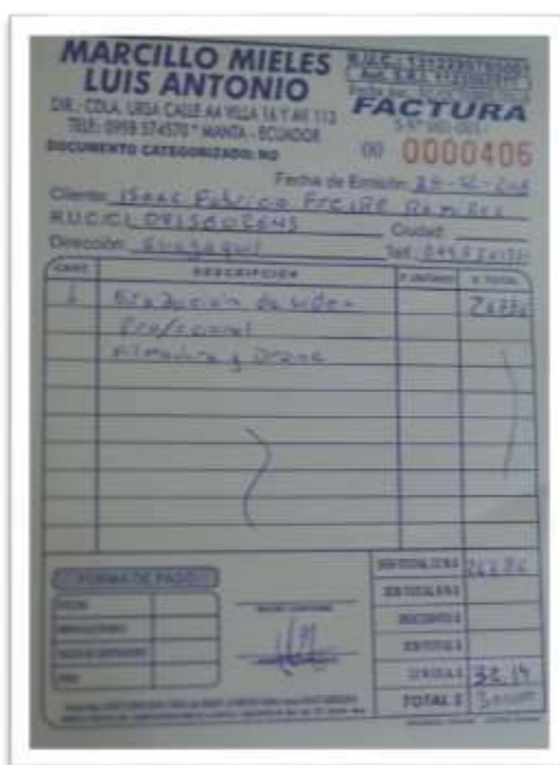
Figura 25.- Factura de alquiler de equipos audiovisuales.

Financieramente se obtuvo un ahorro del más del 50%, ya que el rubro más alto, que era el alquiler de equipos audiovisuales, se logró reducir gracias a la ayuda de amigos tanto de Guayaquil como en Portoviejo, quienes facilitaron sus equipos en calidad de préstamo.