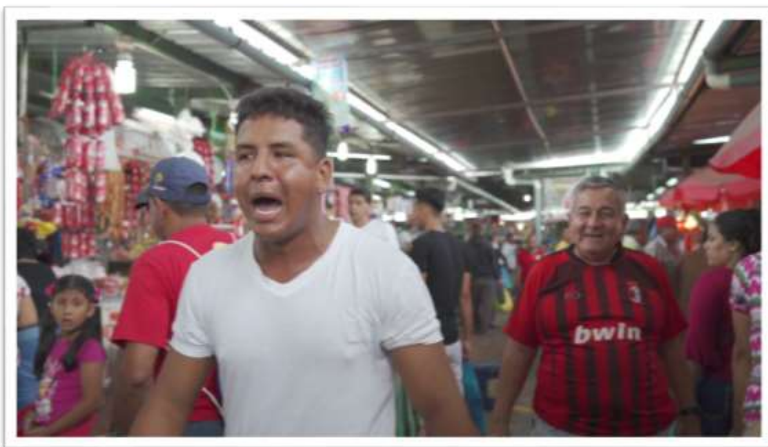
Figura 21.- Actividades económicas de los comerciantes.

Empecé por grabar las actividades diarias de los protagonistas, para ir ganando confianza y poder escuchar sus testimonios. Al grabar los exteriores de la ciudad, empecé a sentir la energía que tiene el pueblo manabita, destacando ese empuje que lleva a la superación de cada familia. Los comerciantes denotaban concentración en sus actividades comerciales, luego de varios minutos empezaron a hacerse bromas entre ellos, lo que permitió la fluidez de las preguntas y respuestas. Los permisos de grabación no fueron necesarios, debido al acercamiento al GAD de Portoviejo, el personal del departamento de Comunicación supieron ayudarme en el proceso de grabación y edición.