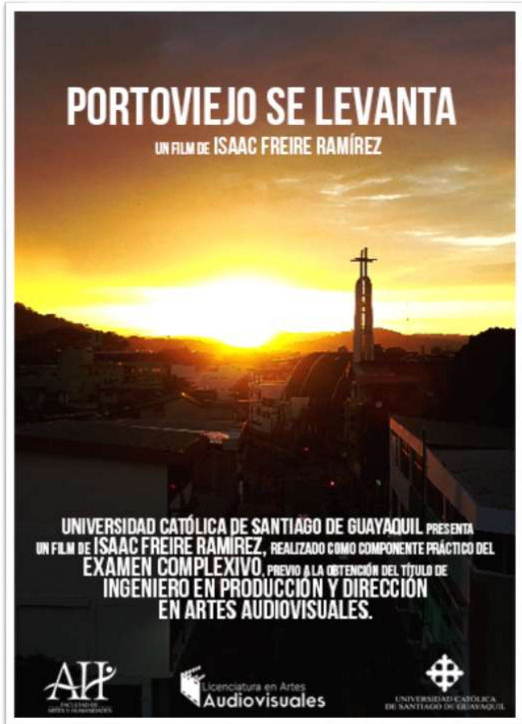
Figura 19.- Afiche para difusión del cortometraje.