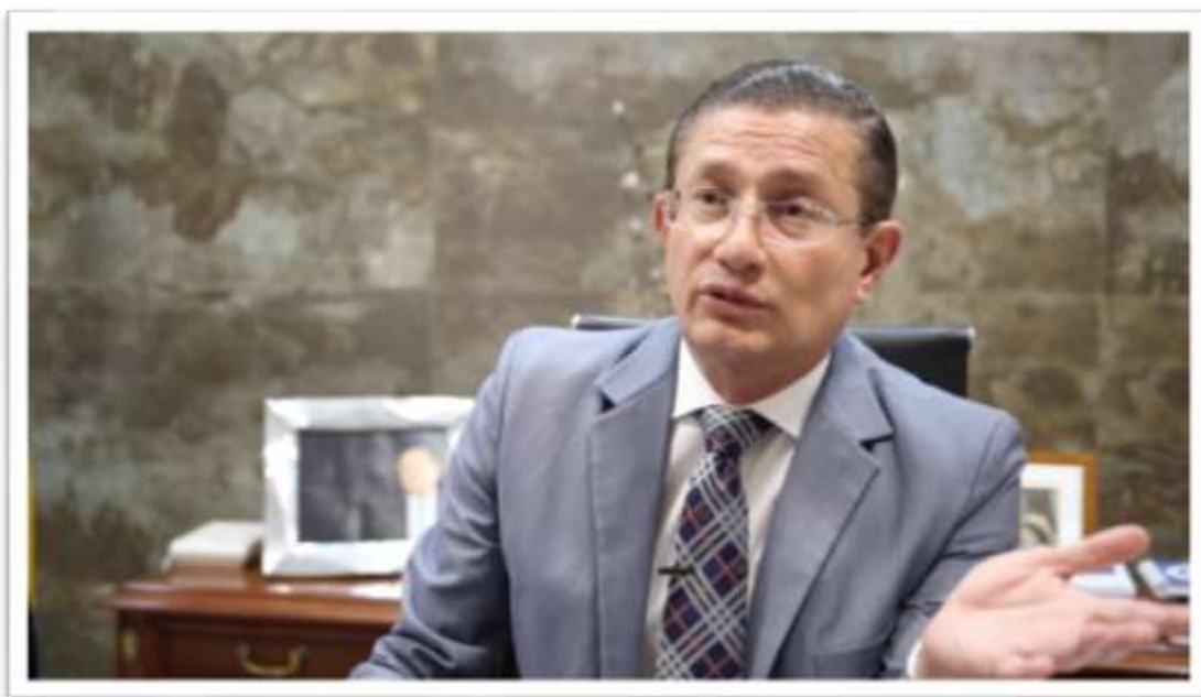
Figura 12.- Alcalde de Portoviejo, Agustín Casanova en su despacho.