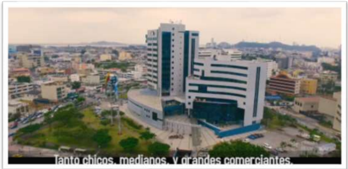
Figura 1. Documental “El Comercio es Empleo”

El tono, contraste y corrección de color se realizará según las siguientes realizaciones audiovisuales: