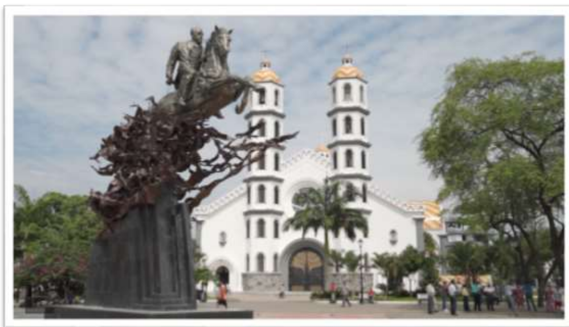
Figura 15: Centro Histórico