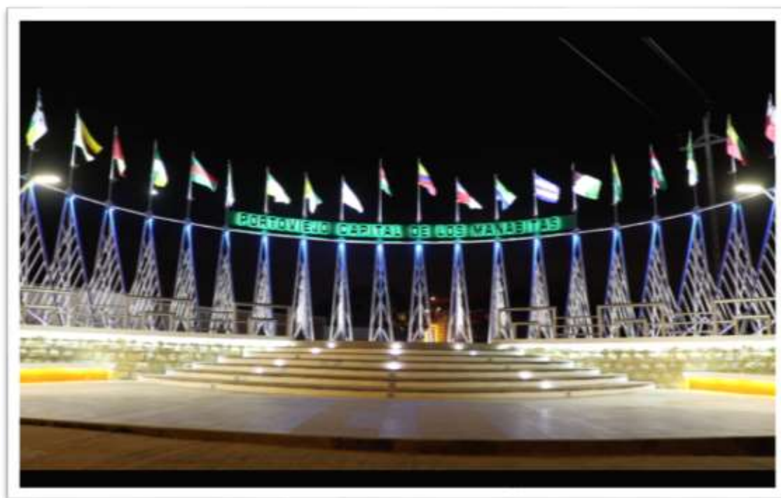
Figura 16: Portoviejo Nocturno