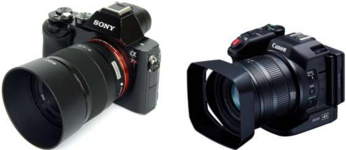
Figura 17 y 18.- Cámaras usadas en la grabación del proyecto.

El equipo que se utilizó en este proyecto audiovisual son las cámaras Sony Alpha 7III y Canon XC10