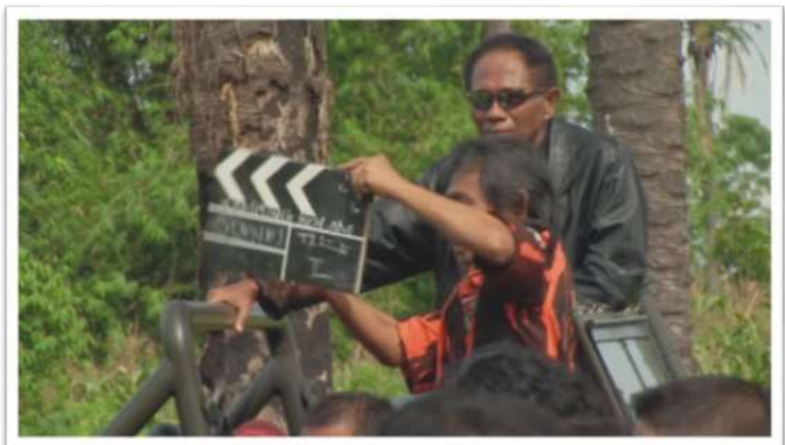
Figura 2. Película Documental “The Act of Killing”