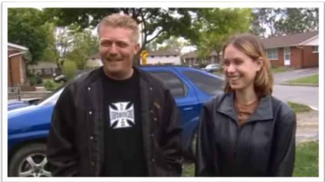
Figura 4. Documental “Sicko”