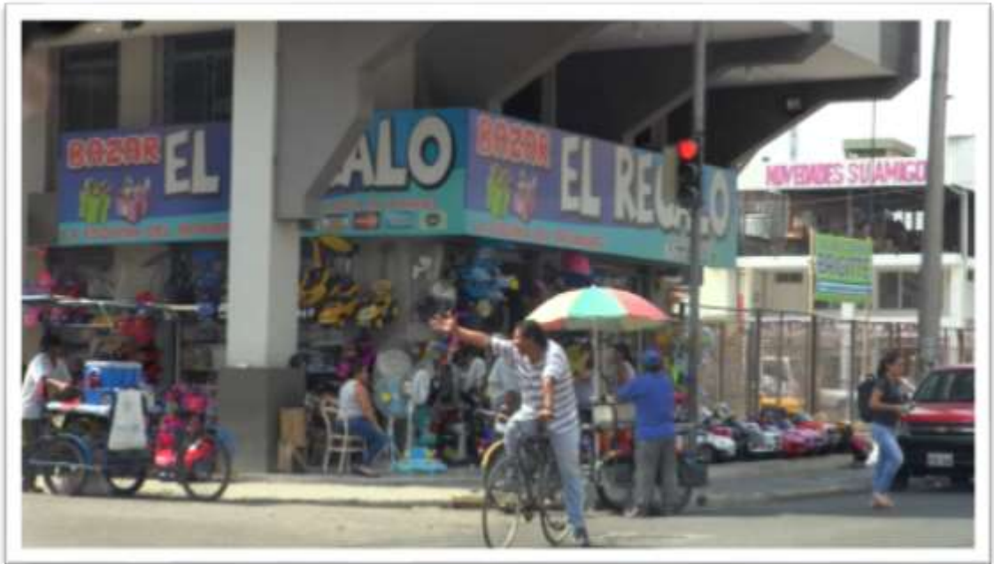
Figura 20.- Fotograma representativo del documental "Portoviejo se levanta".