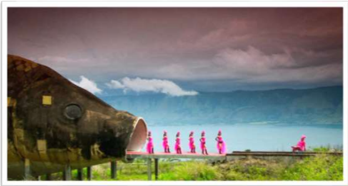
Figuras 7 y 8.- Película Documental The Act of Killing

El documental El Comercio es Empleo recoge varias entrevistas y con los puntos de vista de los entrevistados se va formando y consolidando el tema principal que confronta a la versión oficial que es confrontada varias veces.