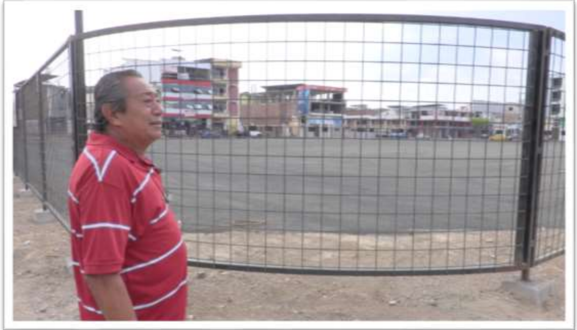
Figura 13: Antiguo Mercado Municipal

Las locaciones se centrarán en la ciudad de Portoviejo.