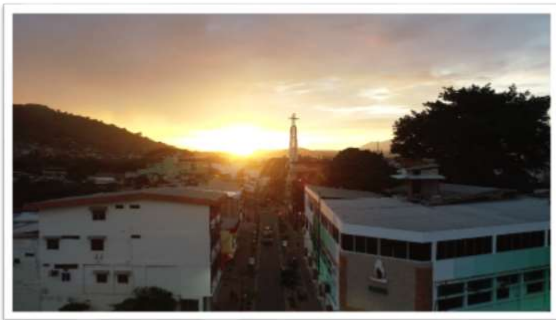
Figura 24.- Atardecer en Portoviejo.

Las condiciones climáticas no permitieron que alcancemos a grabar de manera continua, sino que debimos hacer varias pausas al momento del rodaje. Afortunadamente los aciertos de esta producción se mostraron al momento en que el Alcalde accedió a darnos una entrevista, al igual que los otros 2 protagonistas que al darse cuenta de la seriedad del proyecto, me dieron su consentimiento para la difusión del material grabado.