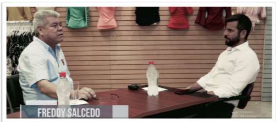
Figuras 5 y 6.- Documental El Comercio es Empleo

Existen 2 referencias que fueron nombradas anteriormente y que se detallan a continuación: