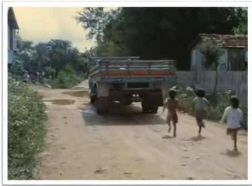
Figura 3. Documental “La Isla de las Flores”