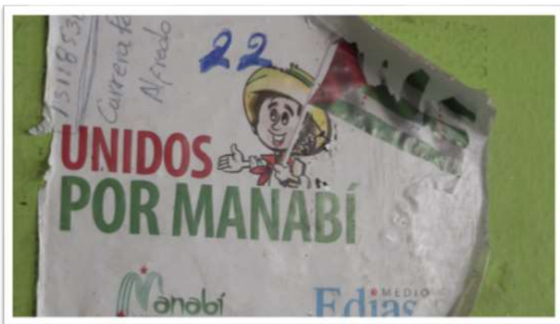
Figura 22 y 23.- Fotogramas representativos del documental "Portoviejo se levanta".