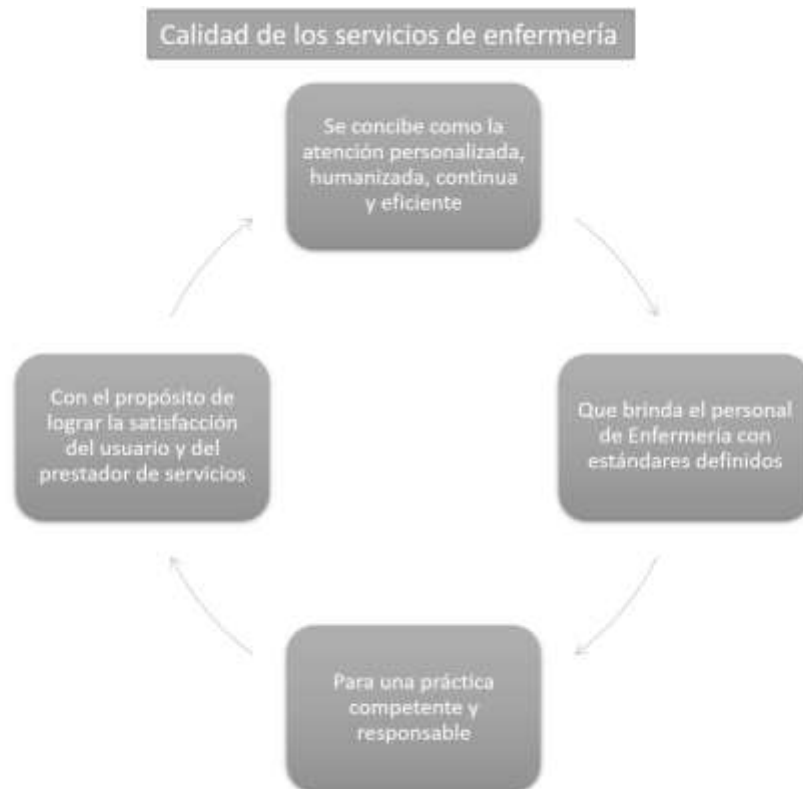
Figura 2. Calidad de los servicios de enfermería.

enfermedad. La satisfacción es en sí un bien de la atención y figura en el balance de beneficios y daños, que es el núcleo fundamental de la definición de la calidad (Pérez de Alejo & García Diez, 2005, pág. 12).