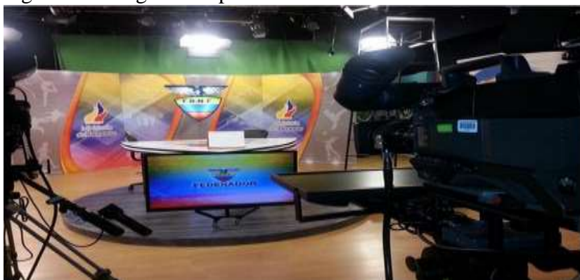
Adaptado de: (Fedenador, 2016)