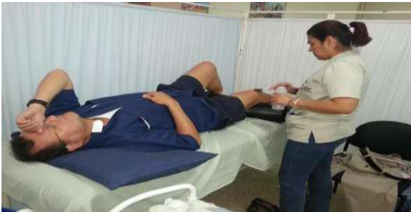
Adaptado de: (Fedenador, 2016)