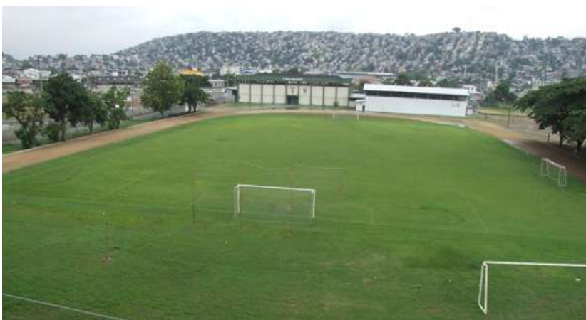
Adaptado de: (Fedenador, 2016)