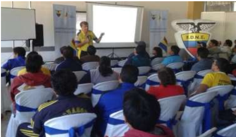
Adaptado de: (FEDENADOR, 2014)