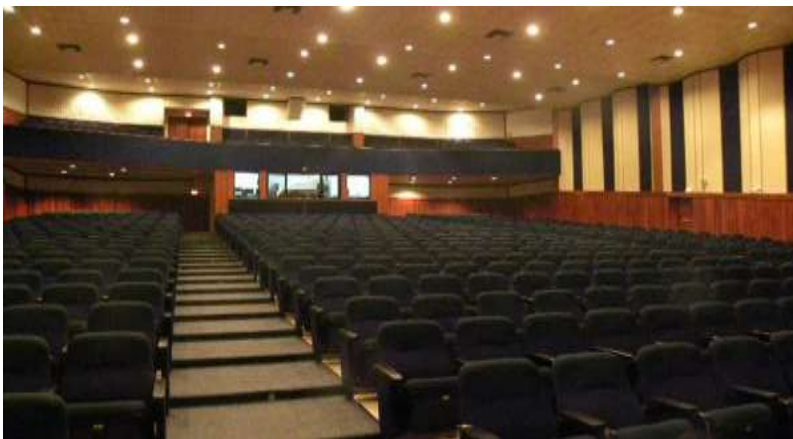
Adaptado de: (Fedenador, 2016)