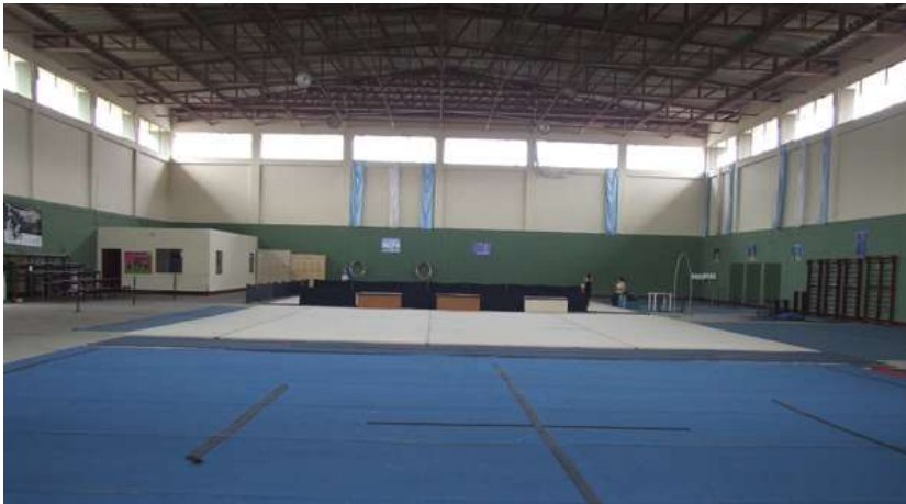
Figura C7. Coliseo cerrado de Gimnasia