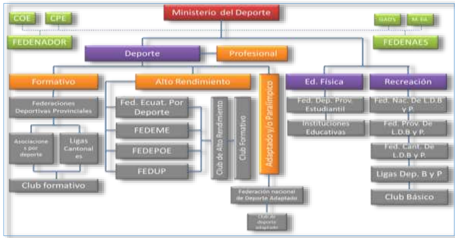
Figura 1. Estructura del Sistema Deportivo Nacional

Como se puede observar la figura anterior, detalla los cuatro tipos deportes establecidos de acuerdo a la ley; a su vez se mencionan los diferentes organismos deportivos que integran cada modalidad de deporte, exceptuando el deporte profesional mismo que será analizado posteriormente en el presente trabajo académico.