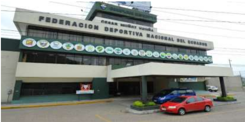
Adaptado de: (Fedenador, 2016)